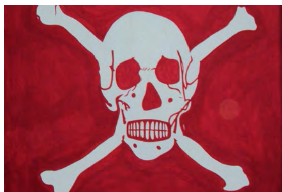
Un panneau indicateur de danger