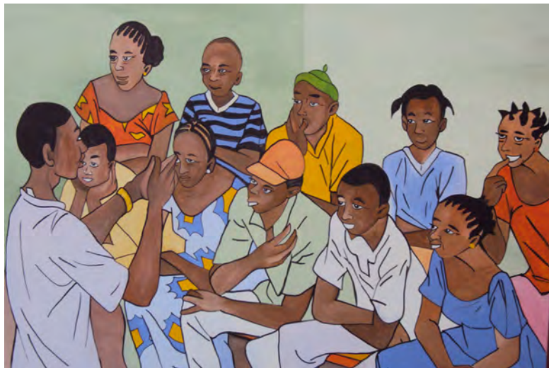
Fresque murale représentant une séance d'éducation au risque

A cet effet, il sera étendu aux zones non encore couvertes par les activités d'éducation au risque.