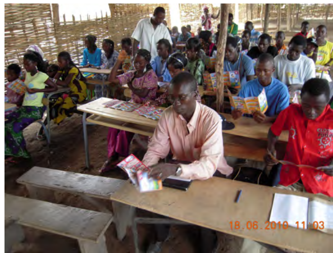
Une séance d'éducation au risque

Toutefois, le CNAMS peut être amené à dérouler des activités ponctuelles d'éducation au risque lorsque le contexte l'exige.