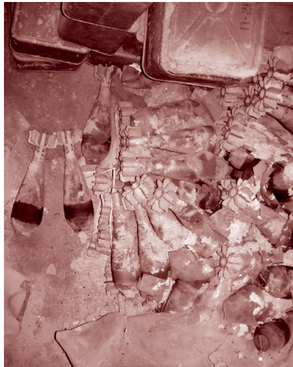
Un dépôt de munitions dans le Puntland, en Somalie. Ces dernières ont été détruites en 2009 avec l'aide du Mines Advisory Group.

Les progrès récents obtenus dans la sensibilisation des groupes armés aux normes humanitaires a conduit analystes et personnel de terrain à suggérer que l'on examine la possibilité d'établir une approche similaire dans le domaine des armes de petit calibre. Un tel dialogue aurait pour objectif de s'assurer que les groupes armés utilisent, entreposent, et gèrent leurs armes de petit calibre dans le respect du droit humanitaire international, du respect des droits humains et des autres normes qui peuvent s'appliquer à ce domaine.