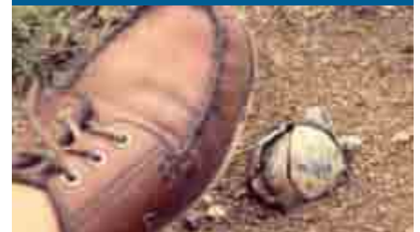
Sous-munition au Laos.

Golfkrieg: 61.000 Streubomben, mit 20 Millionen Einzelmunitionen wurden von den Vereinigten Staaten, Saudi Arabien, Frankreich und Großbritannien zwischen dem 17. Januar und dem 28. Februar 1991 abgeworfen.