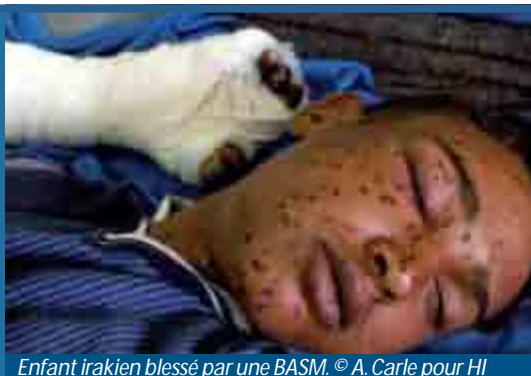
Enfant irakien blessé par une BASM.