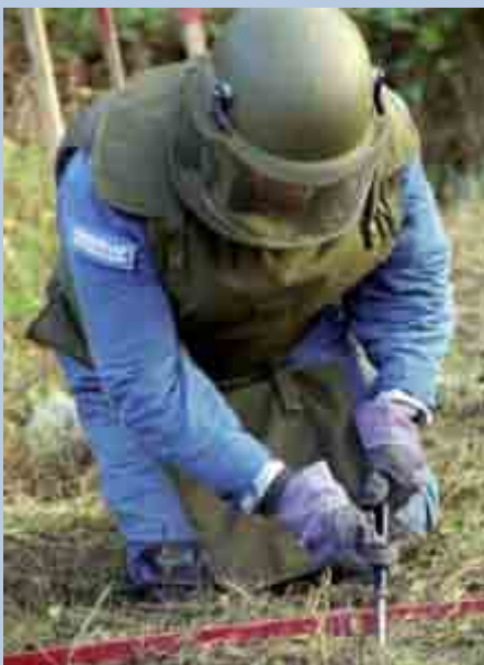
Un démineur en Bosnie

DEPUIS SA CRÉATION EN 1982, HANDICAP INTERNATIONAL AGIT EN FAVEUR DES PERSONNES HANDICAPÉES DANS LES PAYS EN DIFFICULTÉ. PROGRESSIVEMENT, L'ASSOCIATION A ÉTENDU SON CHAMP D'INTERVENTION À LA PRÉVENTION DES ACCIDENTS PAR MINES ET SOUS-MUNITIONS NON EXPLOSÉES (UXO) ET AU DÉMINAGE DES ZONES TOUCHÉES.