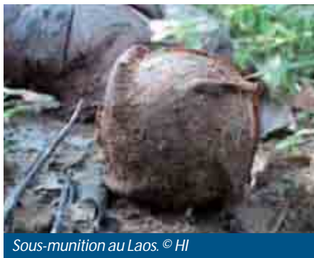
Sous-munition au Laos.

Ces bombes sont composées d'un conteneur (bombe, obus, missile, roquette) regroupant, selon les modèles, une dizaine à plusieurs centaines de minibombes, appelées «sous-munitions». Elles sont larguées par voie aérienne ou terrestre. Le conteneur s'ouvre et éjecte les sous-munitions qui se dispersent alors sur une large zone (pouvant atteindre parfois plusieurs centaines d'hectares), pour exploser, en principe, au contact du sol ou de l'objectif visé.