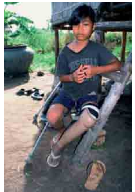
Cambodge: Victime mine

Handicap International poursuit donc son combat et invite la communauté internationale à agir pour que le Traité soit universel, qu'il soit pleinement mis en œuvre et respecté par les Etats signataires, et que les fonds internationaux consacrés au déminage et à l'assistance aux victimes soient augmentés. Paradoxalement, les