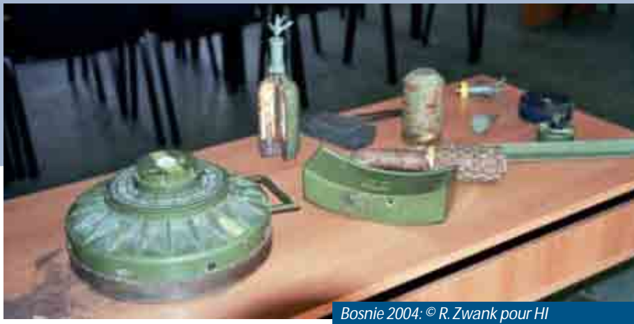
Bosnie 2004: © R. Zwank pour HI