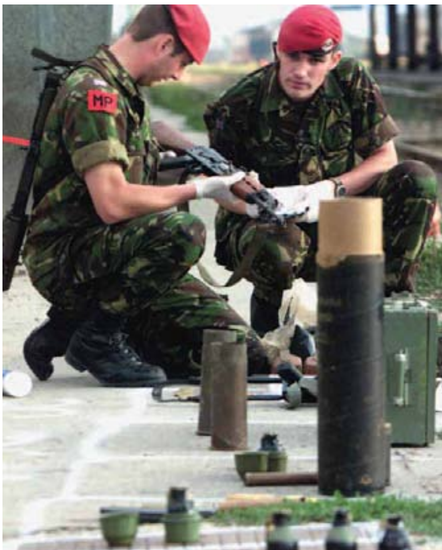
La police militaire britannique examine un fusil de type AKM.

Ce document examinera les cadres normatifs et les mécanismes pouvant être utilisés, en particulier par les OSP, pour tracer les armes de conflit. Il analysera les raisons qui ont jusqu'ici empêché les OSP de tracer des armes. Après un examen des principales caractéristiques de l'Instrument international de traçage (ITI) (AGNU, 2005a), en particulier celles qui concernent le traçage en situation de conflit, il étudiera la pratique courante (ou la non-pratique) des OSP et des Groupes d'experts de l'ONU. Pour conclure, il proposera quelques observations sur les possibilités d'un traçage plus systématique des armes de conflit.