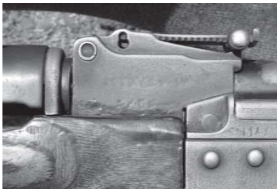
Fusil d'assaut Misr égyptien à la frontière entre le Kenya et le Soudan, mai 2008

jusqu'à identifier, si possible, la partie responsable de la violation de l'embargo.