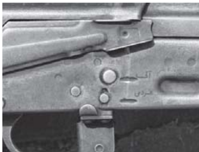
Fusil d'assaut Misr égyptien à la frontière entre le Kenya et le Soudan, mai 2008. Caractéristiques de la crosse (gauche), annotation sur le sélecteur de tir (droite).