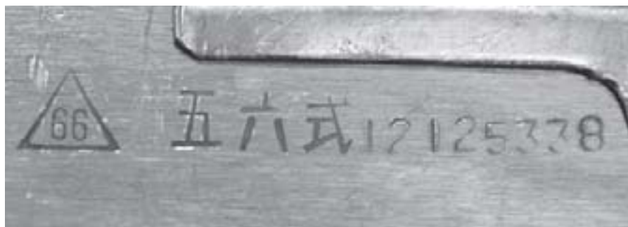
Figure 5 Marques sur le fusil d'assaut Type 56

© James Bevan. Arme reproduite avec l'aimable autorisation des Royal Armouries du Royaume-Uni