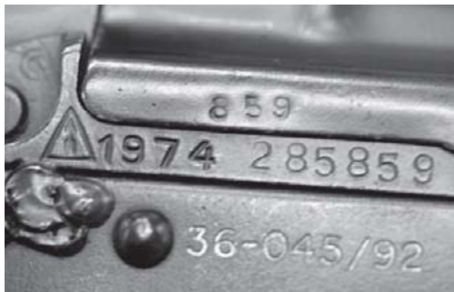
Figure 8 Fusil d'assaut AKM russe fabriqué en 1974 par Ishevsk

© James Bevan. Arme reproduite avec l'aimable autorisation des Royal Armouries du Royaume-Uni