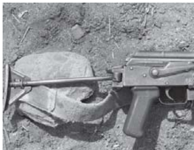
Figure 7 Caractéristiques de conception permettant l'identification du fusil d'assaut Misr égyptien

Les Groupes d'experts ont recours à l'une des trois stratégies énumérées ci-dessus 21 , en fonction des circonstances. En théorie, si la volonté de tracer des armes existe, rien n'empêchera les OSP d'utiliser l'une de ces trois pistes d'enquête. Dans les opérations de traçage, les OSP doivent toutefois prendre en compte deux aspects supplémentaires de la pratique des Groupes d'experts. Premièrement, toute demande de traçage émise par ces Groupes d'experts sont également envoyées en copie à un Comité des sanctions du Conseil de sécurité des Nations unies 22 . Cette démarche confère une légitimité supplémentaire aux demandes de traçage et souligne la nécessité – souvent l'exigence légale 23 – pour les États, les fabricants et les autres