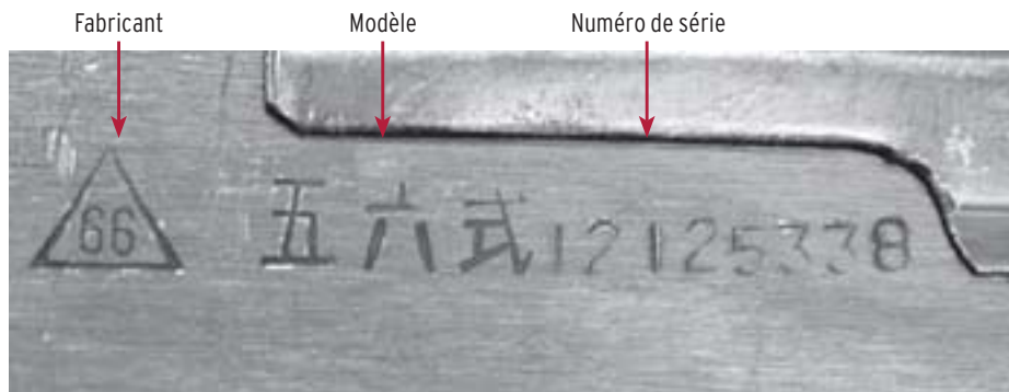
BOÎTE DE CULASSE (CÔTÉ GAUCHE)