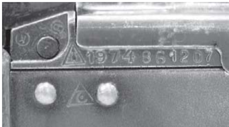
Figure 2 Marque d'importation irakienne sur un AKM de fabrication russe