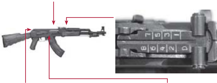
CRAN DE MIRE (HAUT)