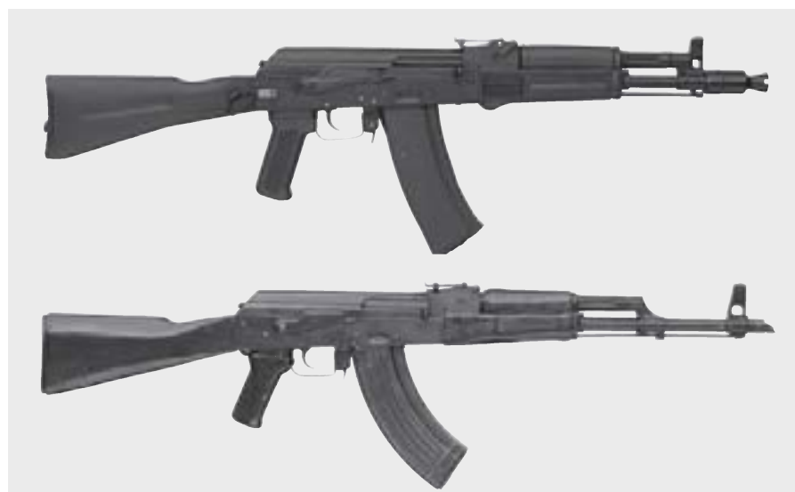
Figure 4 AK-105 (haut) et AKM (bas)