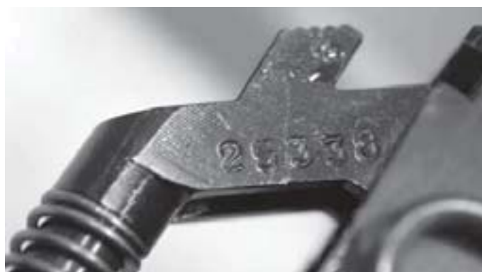
AXE DU RESSORT RÉCUPÉRATEUR