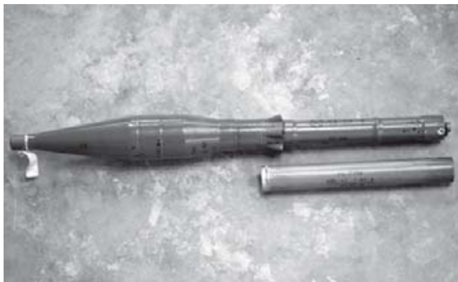
Figure 3 Marques sur une ogive PG-7 et sa charge de propulsion (lance-roquettes RPG-7)

Arme reproduite avec l'aimable autorisation des Royal Armouries du Royaume-Uni