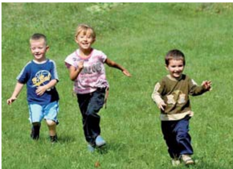
De nouveau avec des amis, Landmine Survivors Initiatives

Une évaluation externe de la présente stratégie menée sous l'égide du DFAE sera terminée fin 2014 au plus tard, afin que les recommandations qui en découleront puissent être intégrées dans la prochaine stratégie.