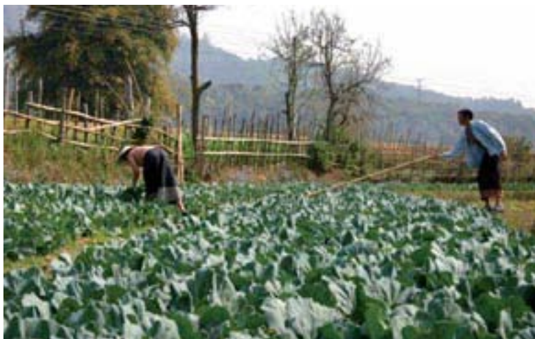
Un exemple de synergies entre l'action contre les mines et la coopération au développement : nettoyage de mines soutenu par le DDPS, appui à la vulgarisation agricole par la DDC

Les mécanismes de coordination de la Suisse dans le domaine de l'action antimines obéissent aux principes de l'approche interdépartementale. Celle-ci a fait ses preuves et sera par conséquent maintenue, au même titre que les groupes de coordination interdépartementaux aux