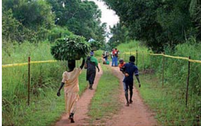
Une route nettoyée dans un environnement dangereux