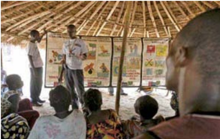
Education au risque des mines en RDC

En outre, des contributions spécifiques sont apportées à la Campagne internationale pour interdire les mines, à la Coalition contre les armes à sous-munitions, à l'Observatoire des mines et armes à sous-munitions (ICBL, CMC, Monitor), au Programme Genre et Action antimines PGAA ainsi qu'à l'Appel de Genève, en tant que partenaire stratégique.