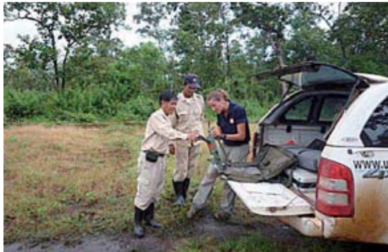
Gestion de qualité par une experte de l'armée suisse, République Démocratique Populaire du Laos

Désireuse de rester un donateur critique, fiable et constructif, la Suisse favorise la proximité avec ses partenaires, qui lui permet d'agir rapidement et de résoudre les questions ardues.