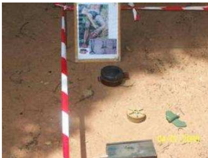
Sensibilisation au profit de militaires béninois au CPADD (2009)

Mais il ne faut pas confondre cette sensibilisation et l'éducation au danger des mines.