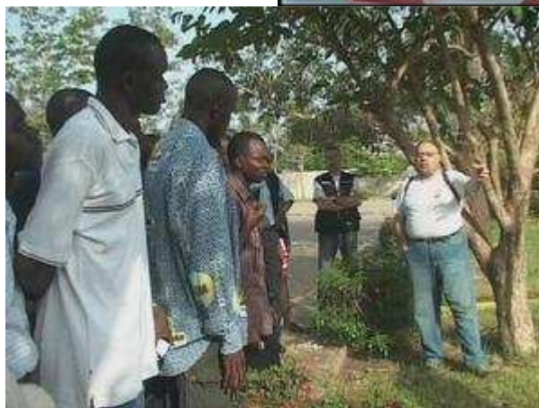
Séance d'éducation au risque des mines avec des mouchoirs d'instruction HAMAP FORMATION (2009)