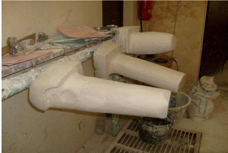
Atelier de confection de prothèses

Le recensement a également permis de déterminer les besoins des victimes afin de leur apporter l'assistance nécessaire et leur garantir un accès gratuit aux services médicaux en termes d'opérations chirurgicales, de prothèses, de thérapies de réhabilitation et de soins post-traumatiques.