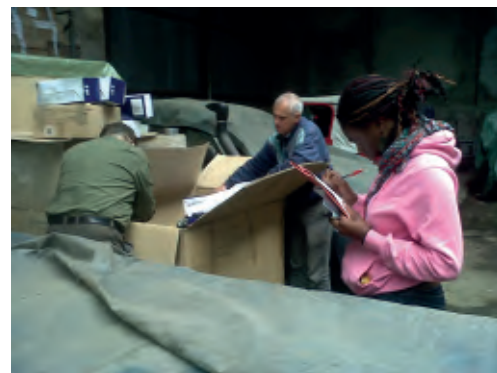
Chargement d'un container

Nous tenons à la remercier pour tout le travail qu'elle a accompli aussi bien dans la relation avec les bénévoles que dans la gestion de la logistique, sans oublier son investissement pour la préparation d'un projet d'accès à l'eau à Madagascar.