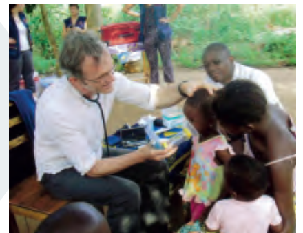
AUTOUR DU MONDE

121 bénévoles sont partis, depuis le début de l'année, lors de nombreuses missions médicales menées en partenariat avec l'association Mission Humanitaire : sept au Bénin, cinq au Cambodge, une en Inde et une à Madagascar. Ces dernières ont permis de soigner et de venir en aide médicalement à 22 400 patients.