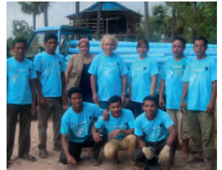
VIETNAM & CAMBODGE