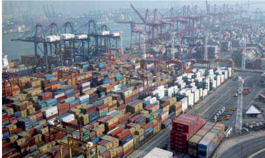
Terminal à conteneurs

Si, en théorie, les services douaniers jouent un rôle clé dans le contrôle physique des biens entrants, sortants et en transit, la pratique est bien différente. Premièrement, dans beaucoup d'États, la tâche confiée aux douanes dans le cadre de la prévention des trafics est assez neuve ou n'est pas considérée comme une priorité. Deuxièmement, un