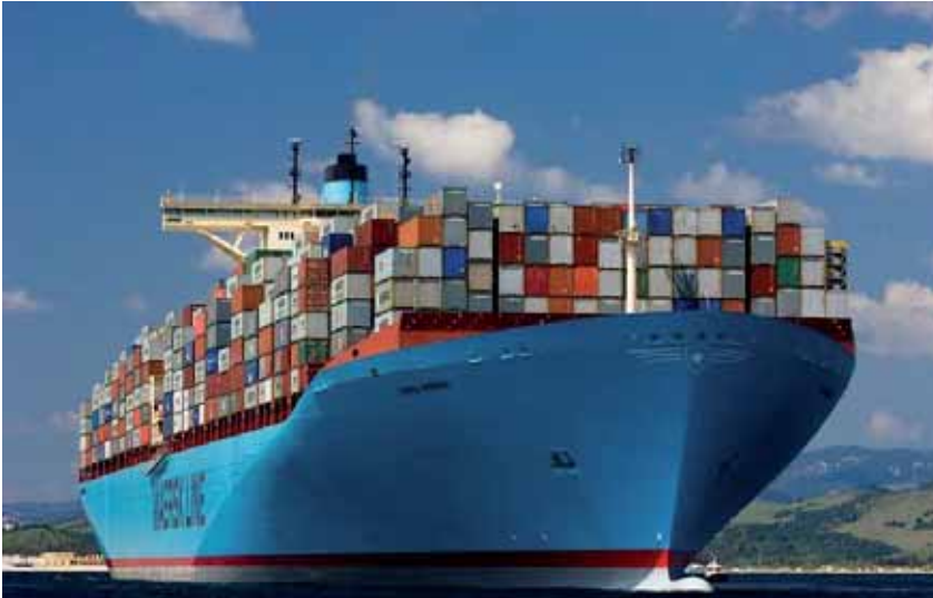
Emma Maersk

Le secteur se caractérise par une forte concentration de la propriété des navires. En 2011, les propriétaires de nationalité grecque détenaient à eux seuls plus de 16,17% du tonnage de port en lourd au monde. La Grèce est suivie de près par le Japon (15,8%), l'Allemagne (9,2%) et la Chine (8,6%), la Corée du Sud (3,79%) et les États-Unis (3,71%) 14 .