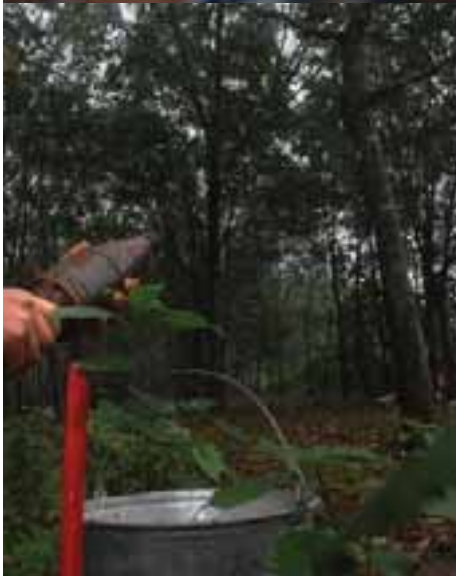
posés autour des trois munitions BLU63

h Communautaire de MAG collecte h Thuy n d'hévéas