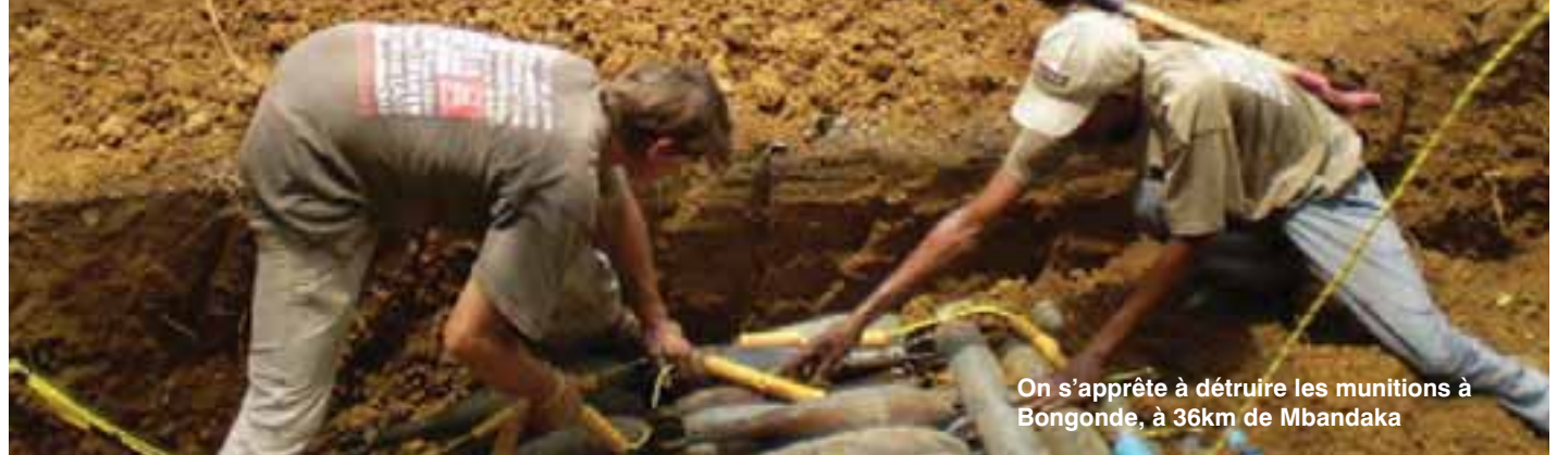
On s'apprête à détruire les munitions à Bongonde, à 36km de Mbandaka