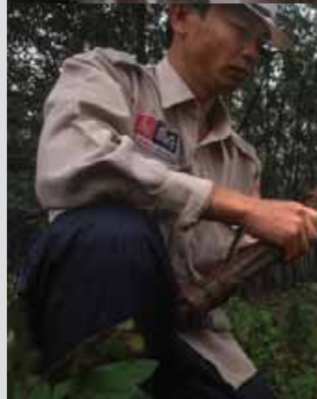
En haut: Les sacs de sable sont posés avant leur destruction Au centre: Le personnel de Liaison Collecte des données dans le village de Vin Thuy En bas: Nettoyage d'une plantation d'h