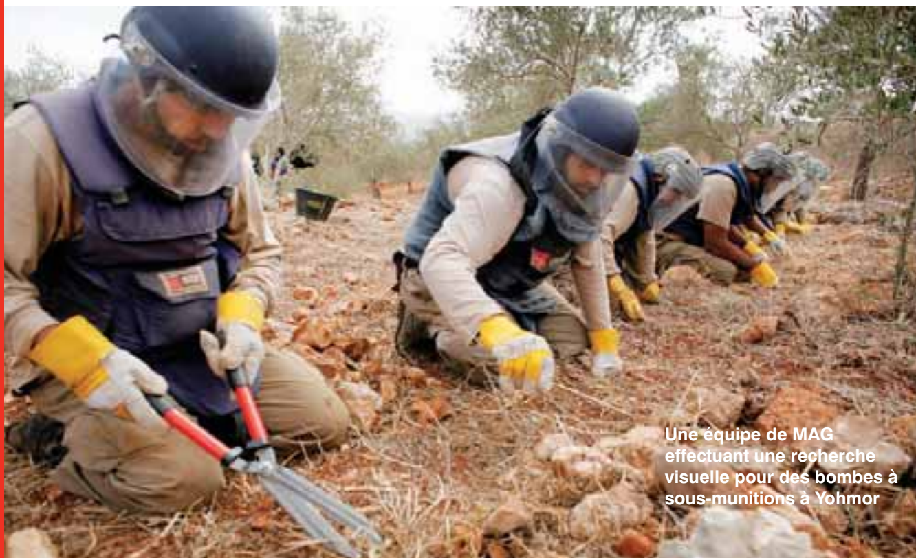
Une équipe de MAG effectuant une recherche visuelle pour des bombes à sous-munitions à Yohmor

À cause de cela, il y a eu deux morts et trois blessés dans les jours qui ont suivi la guerre, alors que les habitants essayaient de nettoyer leur terre des UXO. Un homme est mort en essayant de nettoyer l'entrée du cimetière pour enterrer une victime de la guerre. Chaque famille qui est retournée chez elle à Yohmor après avoir fui les combats s'est retrouvée face à des changements importants et inquiétants, et a soudain réalisé que la vie ne serait plus jamais la même.