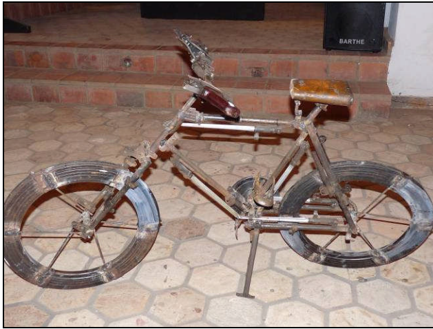
Un vélo fait de morceaux d'armes, réalisé par un artiste du Collectif Maoni et exposé lors de l'événement "Des arts pour consolider la paix"