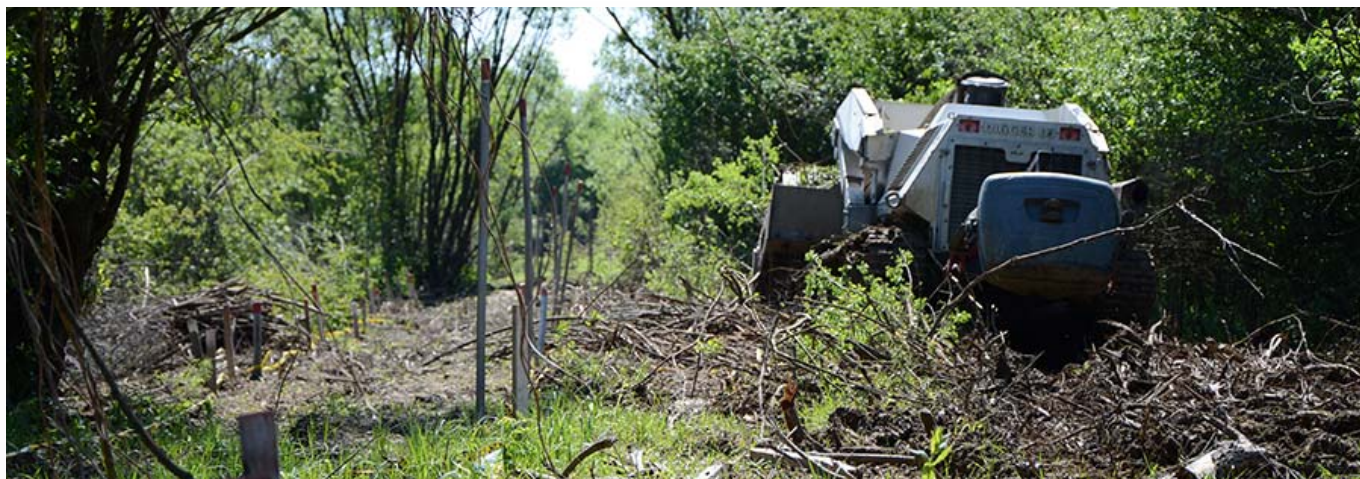
Ouverture d'une voie d'accès par la DIGGER D-3

Au vu des énormes besoins en la matière, l'intégration de notre engin de dernière génération, encore plus puissant, permettrait d'accélérer les opéra-