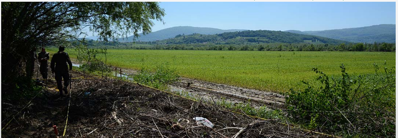
Le blé pousse dans le champs déminé par la DIGGER D-3

Pour rappel, la Bosnie-Herzégovine possède une DIGGER D-3 qui a été offerte en 2009 par l'orga-