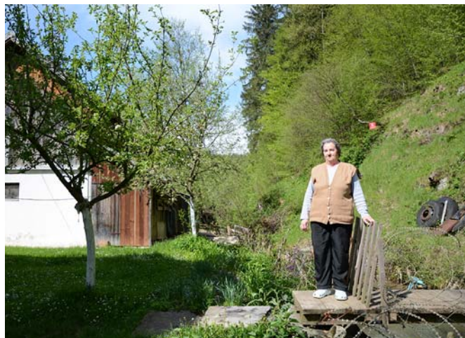
La vie à côté des mines

Elle sera contrainte de demander une prolongation du délai (2024). Actuellement, nous travail-