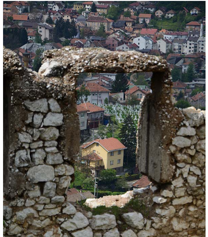
Cicatrices de la guerre dans une ville en pleine reconstruction (Sarajevo)

de 500'000m 2 , permettant de restituer plus de 8 millions de m 2 à la population et participant à la destruction d'au moins 600 mines antipersonnel.