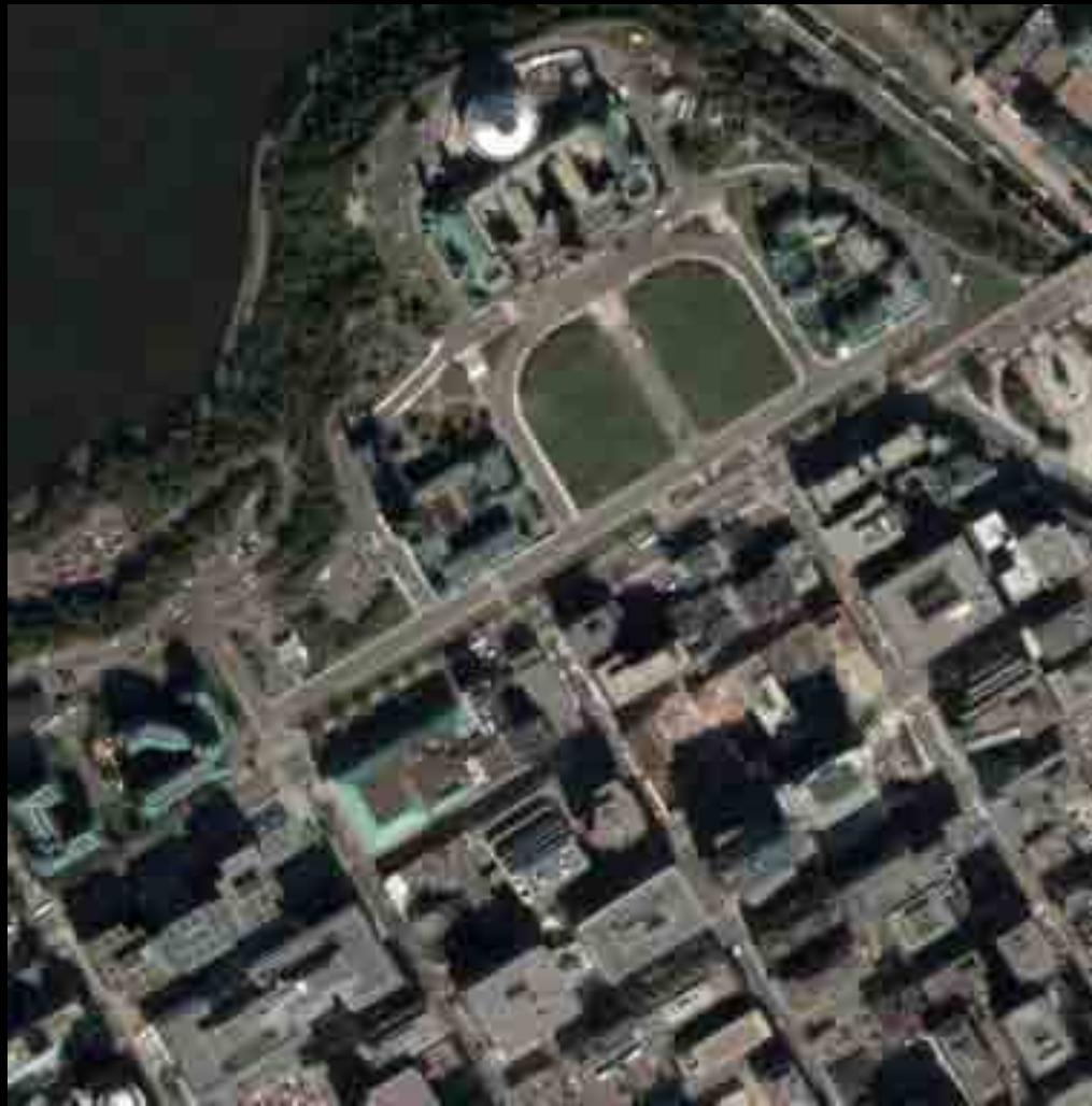
Vue aérienne de la Colline du Parlement, Ottawa