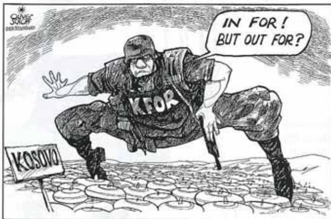
Oliver Schopf, Der Standard (Vienne): "Ici pour! Mais parti pour?"