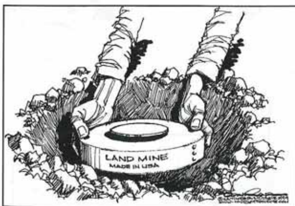
Paul Conrad, Los Angeles Times: Pour la fête de l'arbre, jour des plantations.