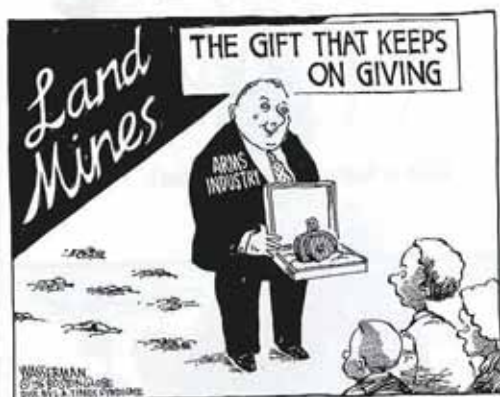
Dan Wasserman, Boston Globe (Boston): "Le don éternel".