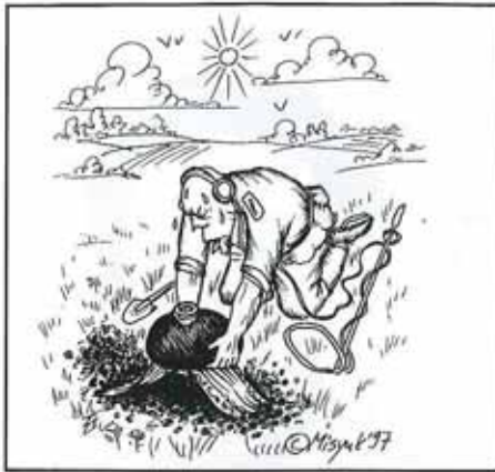
Vadim Misyuk, FAS (Moscou): autre vision de l'accueil à la russe (coupelle de sel et un pain rond sur un linge).