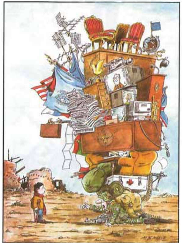
Marco de Angellis, La Repubblica (Rome).