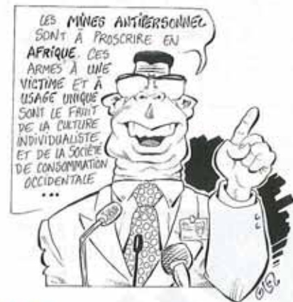
Glez, L'Autre Afrique (Burkina).