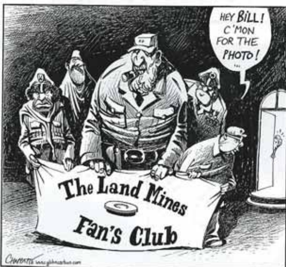
Chappatte, Die Weltwoche (Zurich). Khadafi, Castro et...: "Eh Bill, ramène-toi pour la photo!"