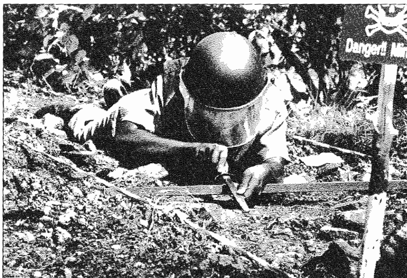
Le déminage d'une route dans la province de Battambang, au Cambodge.

à 100 % reste un objectif non négociable, quelle que soit l'ampleur de la zone traitée.