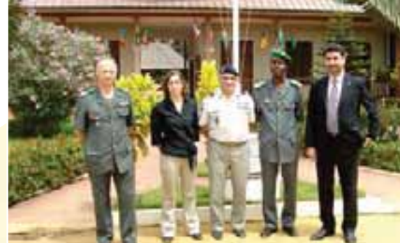
Délégation Genevoise et Angevine à Ouidah...