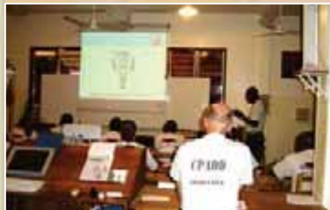
... et séance d'instruction en salle au CPADD