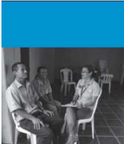
Collaboratrice d'Handicap International conduisant des entretiens en Colombie

Traduction du chapitre « Global victim assistance (VA) progress on the ground », tiré du rapport « Voices from the Ground – Landmine and Explosive Remnants of War Survivors Speak out on Victim Assistance », publié par Handicap International, septembre 2009.