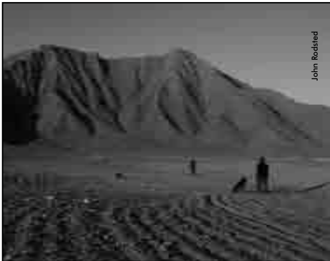
Déminage par l'ATC, mont Paghman, près de Kaboul