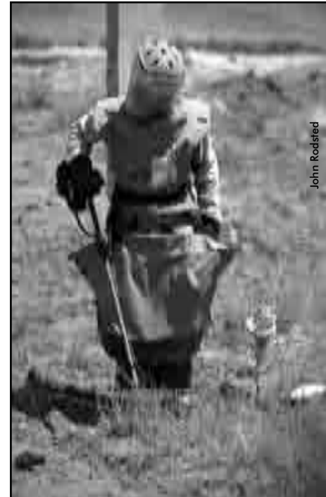
Démineur ATC près de Kaboul

M. Barber conclut en réaffirmant la détermination des Nations unies à travailler pour bâtir un monde sans mines. « Les Nations unies demeurent fermement engagées à éliminer le danger que représentent les mines et les engins non explosés et continuera à faire sa part pour universaliser l'interdiction des mines antipersonnel. »