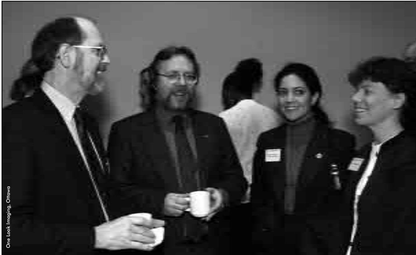
One Look Imaging, Ottawa