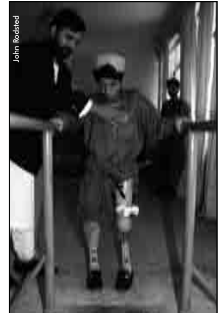
Garçon apprenant à marcher, Handicap International, Kandahar

Ensuite, M. Axworthy fait état d'un rapport sur l'intervention humanitaire et la souveraineté de l'État issu de la Convention d'Ottawa et intitulé La responsabilité de protéger 3 . Le rapport