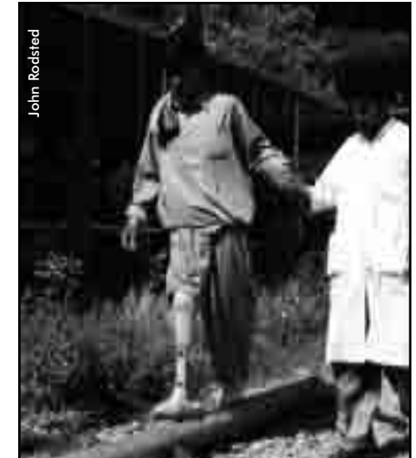
Réadaptation au CICR à Kaboul