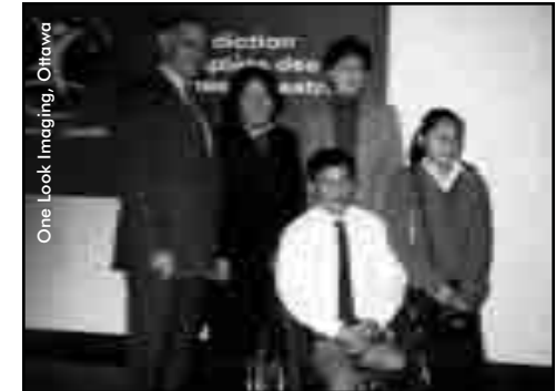
L'honorable Bill Graham et l'honorable Susan Whelan avec Tun Channareth et Song Kosal, ambassadeur de l'ICBL et Sok Eng de la campagne Cambodgienne pour l'interdiction des mines, lors de la cérémonie de renouvellement du Fonds Canadien contre les mines terrestres, avant le symposium.