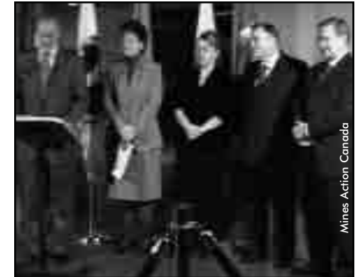
Mines Action Canada