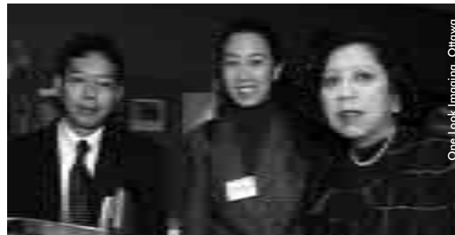
Les représentants du gouvernement de la Thaïlande. La Cinquième Assemblée des États Parties se tiendra en Thaïlande au mois de septembre 2003.