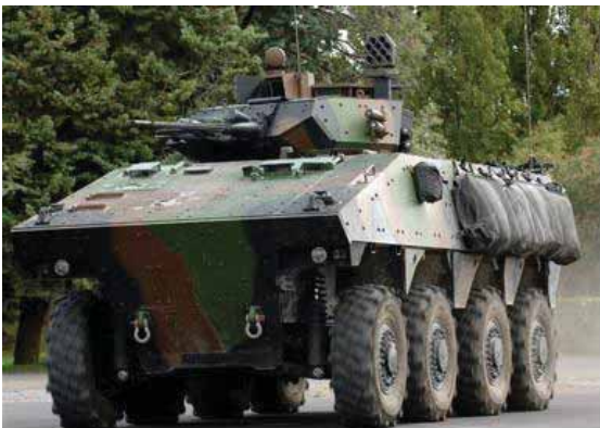
Véhicule blindé de combat

Dans sa résolution de 1991 sur la transparence dans le domaine de l'armement, l'Assemblée générale demande aux États de fournir annuellement des informations sur leurs exportations et importations d'armes conventionnelles. Sept catégories d'armes conventionnelles ont été définies : les systèmes d'artillerie de gros calibre, les avions de combat, les chars de combat, les hélicoptères d'attaque, les véhicules blindés de combat, les navires de guerre et, enfin, les missiles et les lanceurs de missiles 2 .