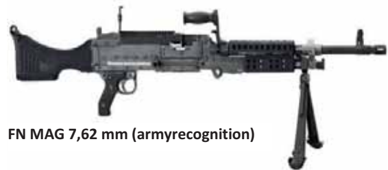
FN MAG 7,62 mm

Une analyse des rapports fournis en 2009 dans le domaine des transferts d'ALPC est évocatrice de la faiblesse de la participation belge au Registre. C'est la première fois que la Belgique soumet des informations sur ses transferts d'ALPC alors que les États sont invités à le faire depuis 2003. Comme l'annexe 1 le montre, elle ne signale qu'une exportation de 55 mitrailleuses légères MAG 7,62mm vers l'Uruguay pour l'année 2008 22 . Il s'agit vraisemblablement de mitrailleuses montées sur des véhicules blindés vendus par le pouvoir fédéral à l'Armée uruguayenne 23 . Cependant, l'analyse des rapports des autres États, reprise dans l'annexe 2, renseigne sur davantage de transferts impliquant la Belgique. Dix-sept États mentionnent trente-trois exportations d'ALPC en provenance de la Belgique. Aussi, il semble invraisemblable qu'elle n'ait exporté des ALPC qu'à l'Uruguay pour l'année civile 2008. Plus largement, l'ensemble des informations fournies par la Belgique au Registre sur ses exportations d'armes conventionnelles pour l'année civile 2008 concernent vraisemblablement exclusivement des transferts effectués au niveau fédéral 24 .