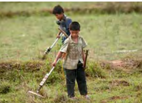
Deux enfants laotiens collectent du métal dans les champs.

Le Laos a ratifié le Traité d'interdiction des bombes à sous-munitions le 18 mars 2009.