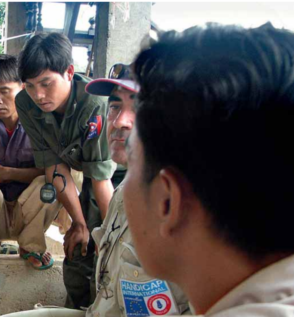
Handicap International est engagée depuis 1996 à la formation des équipes de débombage de l'organisation nationale UXO lao.

Ce Traité est une victoire indéniable pour tous les survivants d'accidents de sous-munitions dans le monde. C'est une avancée historique qui permettra enfin au Laos de voir sa situation évoluer. Ce sera d'autant plus le cas pour ce pays, qu'il est l'hôte de la première conférence des Etats parties au mois de novembre 2010 à Vientiane (capitale).