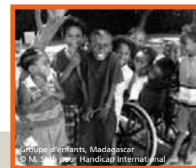
Groupe d'enfants, Madagascar