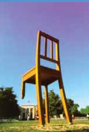
Page 16, photos de gauche à droite © S. Schiller © J.-L. Rossier / Handicap International © MGA