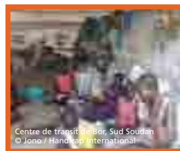
Centre de transit de Bor, Sud Soudan