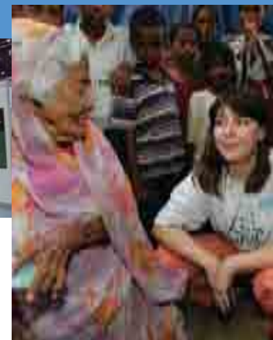
Page 17, photos de gauche à droite © ZEP, Euro RSCG Salon du Livre © Handicap International © B. Kormann - L'illustré / Handicap International