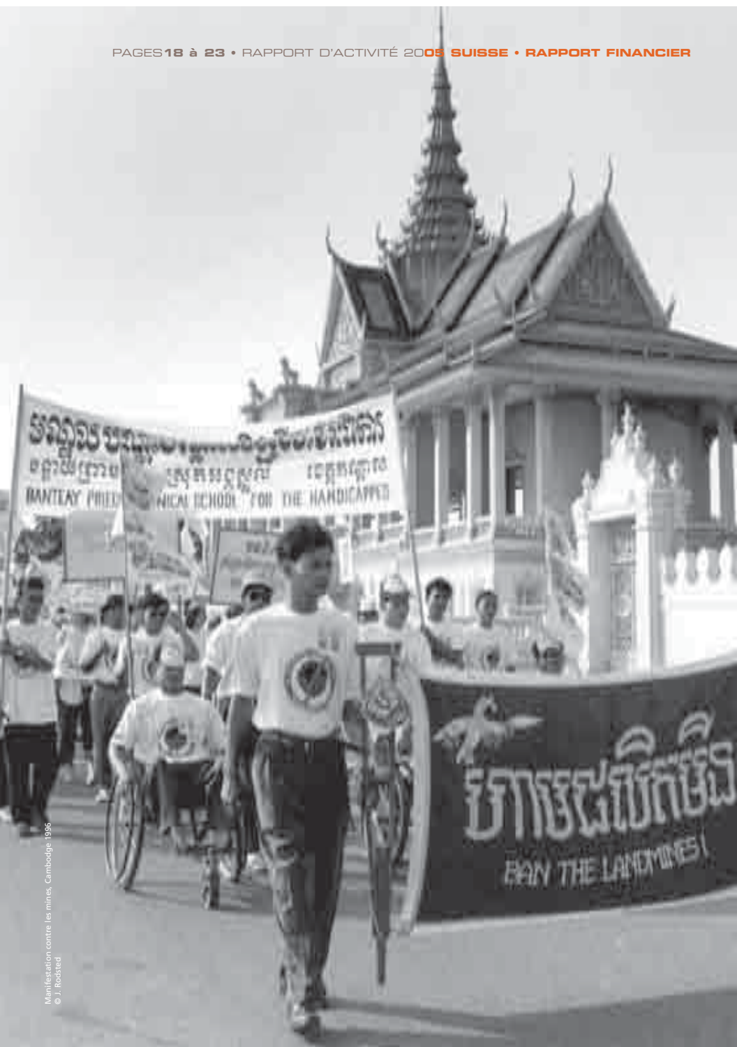
Manifestation contre les mines, Cambodge, 1996