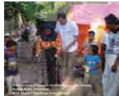
Intervention d'équipes mobiles auprès des blessés, Banda Aceh, Indonésie.