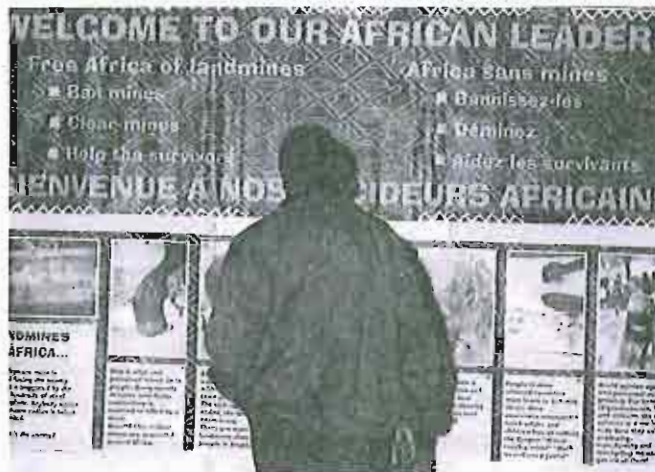
Un participant à la conférence de l'OUA trouve des informations supplémentaires sur les mines en Afrique.

l'attention médiatique ? La cérémonie d'ouverture ou de clôture ? Une activité ouverte au public ? Sachez qu'il est difficile de faire l'objet d'une couverture médiatique plus d'une fois au cours d'une conférence, aussi faut-il concentrer tous ses efforts sur un moment important et organiser pour la suite des interviews individuels.