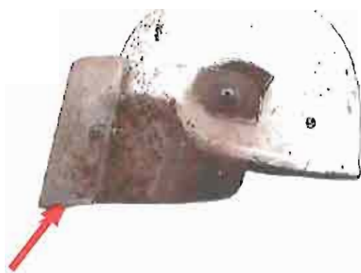
Ce casque et cette visière ont été utilisés lors d'un accident ayant provoqué des blessures aux yeux.

Les visières attachées aux casques conçus pour un usage militaire sont souvent relativement éloignées du visage et s'évasent vers le bas. Elles offrent ainsi une bonne ventilation, mais ne sont pas prévues pour protéger d'une menace qui vient le plus souvent d'en dessous (les accidents les plus courants se produisent durant la phase de sondage/excavation).