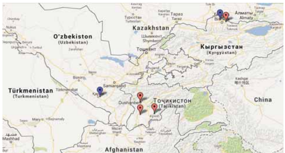
Carte 3 – Emplacement des bases militaires américaines et russes dans la région

En bleu : bases américaines, fermée en 2005 (Karchi-Khanabad, Ouzbékistan) ou devant fermer en 2014 (Manas, Kirghizistan) ; en rouge : bases russes, toujours en activité (Kant, Kirghizistan ; Douchanbé, Kulob et Qurghonteppa, Tadjikistan).