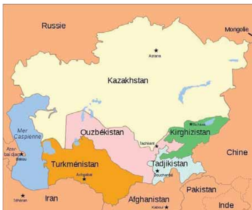
Carte 1 – L'Asie centrale et sa région

deux révolutions ayant conduit à la chute du pouvoir central, en 2005 et en 2010 ; en Ouzbékistan, la violente répression des manifestations dans la ville d'Andijan, en mai 2005, a causé la mort de plusieurs centaines de civils 7 et entraîné la prise de sanctions de l'Union européenne à l'égard du gouvernement 8 ;