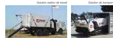
Solution station de travail