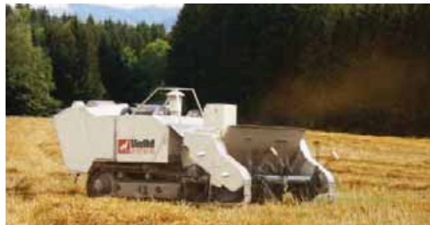
Mini MineWolf avec fléaux