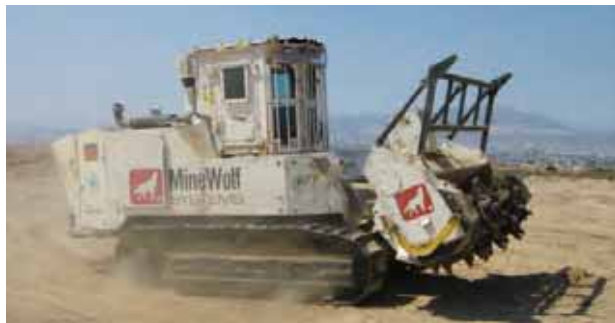
MineWolf avec charrue