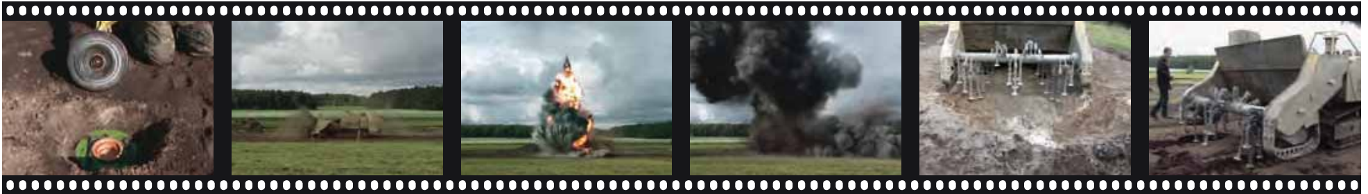
Elimination de mines antichar enterrées de type TM-62 P3 et PT-MI-BA III avec le Mini MineWolf lors d'une série de tests effectués en 2007.