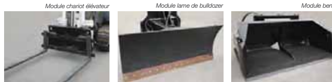
Module chariot élévateur