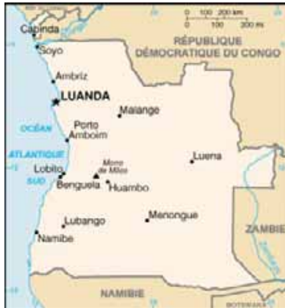
Carte de l'Angola (55(*))

L'Etat angolais est né en 1975 . Les frontières actuelles résultent de la colonisation européenne mais les nationalités africaines priment toujours sur le sentiment national.