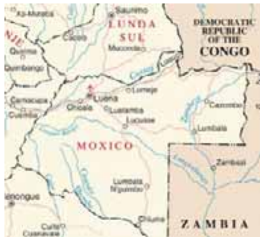
La carte des provinces les plus touchées par les mines terrestres

Dans la province de Moxico, le MAG a déminé la zone d'opérations, qui contenait une évaluation de 38% du pays très touché, avec un taux de prévalence général de deux fois la moyenne du pays. Le Gouvernement angolais a pris une stratégie globale en place pour éliminer l'obstacle des mines terrestres ; le MAG aide à la mise en oeuvre de cette stratégie dans la Province de Moxico. Comme l'a déclaré CALENGA, "le MAG est un des plus importants partenaires gouvernementaux dans le développement de l'action antimines humanitaire dans l'Est de l'Angola». (170 (e) )