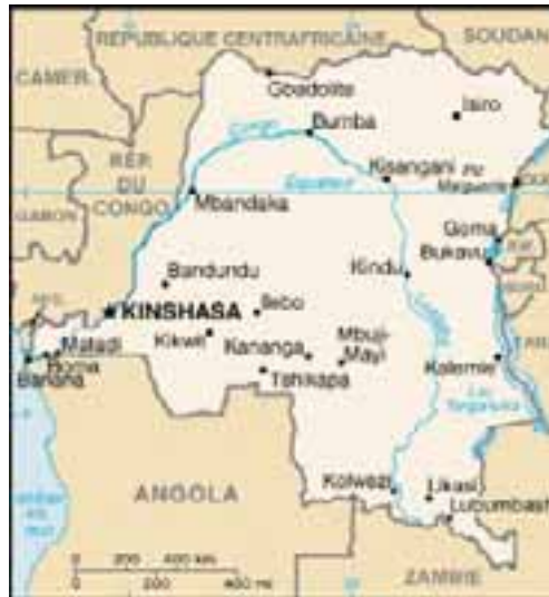
La carte de la RDC (66*)

La République Démocratique du Congo a une superficie totale de 2 345 410 km 2 ; 2.267.600 Km 2 de superficie terrestre et 77.810 km 2 de superficie maritime. Elle est implantée en Afrique Centrale ; bordant le Nord de l'Angola et de la Zambie ; bordant l'Ouest du Rwanda et du Burundi.