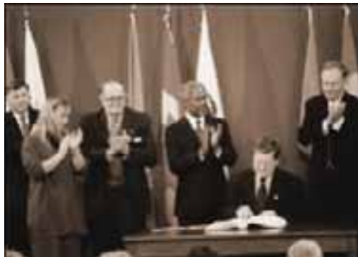
Signature du traité d'Ottawa 1997

Depuis, ce réseau s'est étendu à 1400 groupements. Certains s'occupent de femmes, d'enfants, d'anciens combattants, d'environnement, des droits de l'homme, du contrôle de l'armement. D'autres sont des groupes religieux, en faveur de la paix, ou du développement durable. Ils représentent 90 nations et travaillent sur le plan local, national et international pour éliminer les mines antipersonnel.