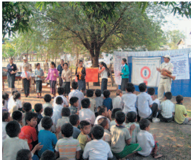
Le comportement adéquat reste vital: partout, des engins de combat abandonnés.

Alors que des détecteurs de métaux fiables coûtent plus de 3000 francs, les Laotiens se procurent pour 12 francs des appareils bon marché au Viêt-Nam voisin. C'est en sandales, sans casque, ni gilet ou combinaison de sécurité que des hommes surtout partent en quête, souvent accompagnés de leurs fils malgré la scolarisation obligatoire. Des entreprises spécialisées dans la fonte payent 25 centimes du kilo. Les accidents sont réguliers. Deux semaines après la visite de MSM, des munitions non explosées déchietaient les jambes de deux garçonnets. Mais on ne voit pas de blessés, rapporte Claudine Bolay. «Nous ignorons où sont ces gens. L'on peut penser qu'ils se cachent chez eux par honte de faire ce travail.» La plupart n'a pas l'argent nécessaire au traitement des blessures. De plus, il faut douze heures pour atteindre l'hôpital le plus proche situé au Viêt-Nam et plus encore pour la capitale laotienne, Vientiane.