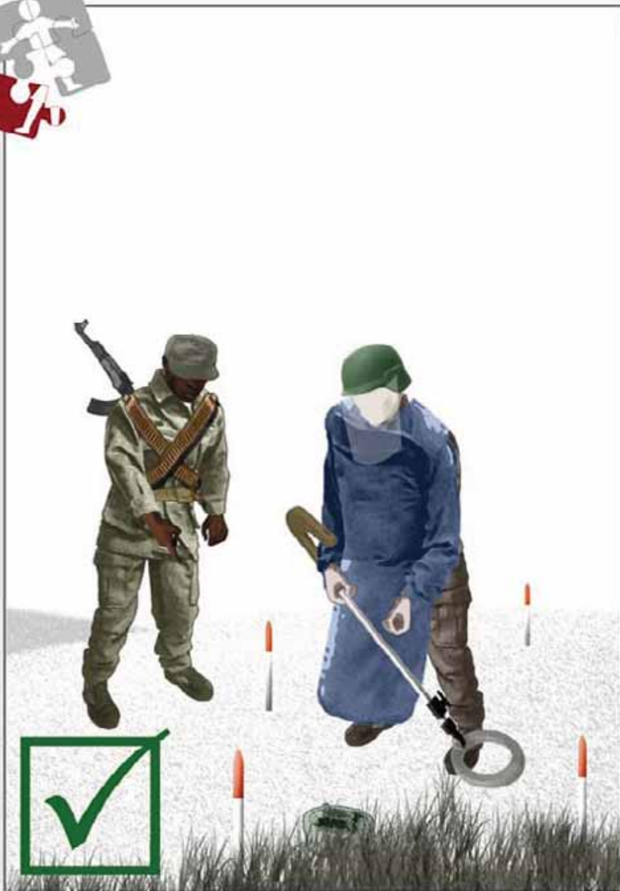
8. Coopérer activement aux opérations de déminage.