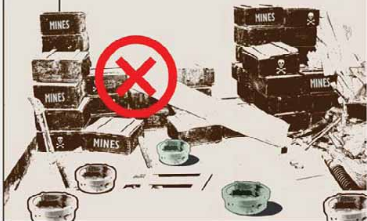
4. Ne pas garder ou stocker des mines antipersonnel. Toutes les mines antipersonnel doivent être détruites.