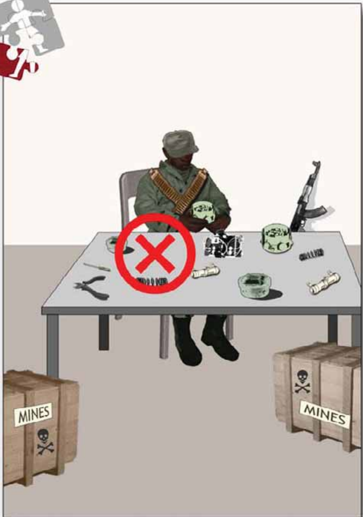
2. Ne pas fabriquer ou produire des mines antipersonnel.