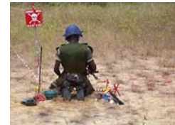
Bénin - Voyage de terrain de la Cnema - 2006

D'un point de vue opérationnel, les efforts consentis par la France sont significatifs, avec un niveau d'aide globale (bilatérale et multilatérale) similaire à celui de ses principaux partenaires européens. Sur le terrain, ces efforts se traduisent par des actions de dépollution de sites contaminés, d'aide à la destruction de stocks, d'assistance aux victimes et de formation aux techniques de déminage et de dépollution. Sur le plan géographique, notre action s'est essentiellement concentrée, au cours de ces dernières années, sur les pays ou les régions les plus affectés par ce fléau, notamment l'Afrique francophone.