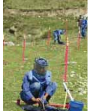
Un démineur de la FSD au Tadjikistan An FSD deminer in Tajikistan

affectée aux salaires des démineurs et du personnel de coordination sur le terrain et à l'achat d'équipement adapté aux conditions de chaque lieu d'intervention. 10 % des fonds sont alloués au siège qui a pour mission de soutenir et de contrôler les opérations, d'effectuer la comptabilité, de procurer le soutien en logistique et en ressources humaines, de développer les programmes ainsi que de gérer l'administration générale.