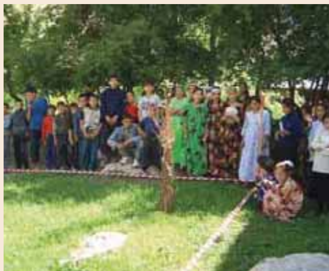
Sensibilisation aux dangers des mines au Tadjikistan Mine awareness in Tajikistan

With the creation of two new demining teams in 2005, the volume of FSD activities in Tajikistan more than doubled in relation to 2004. The operational performance is excellent, given that 50% of Tajik deminers