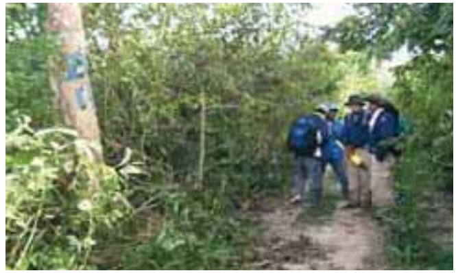
EOD technician examining the ground Technicien EOD en train d'examiner le sol

A la demande de l'organisme national de lutte contre les mines, UXO Lao, la FSD va prendre en charge la formation à un niveau avancé de 20 techniciens spécialisés en neutralisation et destruction des explosifs durant cinq mois. Ce projet, vital pour les populations, est en partie financé par le gouvernement australien. La Fondation Greendale, le Fond mécénat des