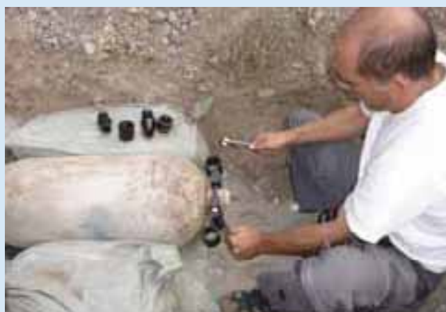
Désamorçage d'un gros calibre Disarming of a large bomb

It is often difficult to measure the immediate effects of mine action. Type and density of contamination by landmines and other explosive remnants of war vary tremendously from context to context. Furthermore, mine action projects achieve best impact only when they are tightly integrated into overarching reconstruction and development initiatives. In order to systematically assess the quality and impact of its demining projects, FSD is applying a set of specific indicators (see diagram below). This chart illustrates the relevant quantitative as well qualitative indicators