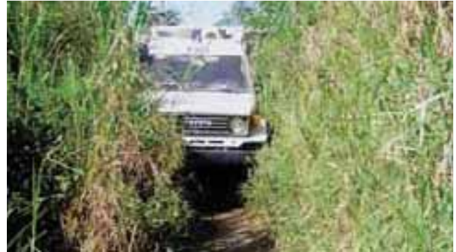
Traversée de la jungle dans la province d'Ituri Crossing of the jungle of Ituri province

Les efforts intenses auprès de la communauté internationale des donateurs n'ayant pas abouti, la FSD a dû se résoudre à licencier ses équipes, l'ensemble des véhicules et de l'équipement étant transféré au Burundi voisin en appui au programme local.