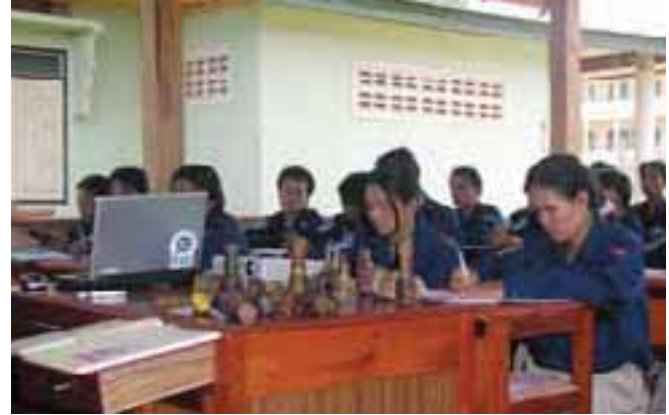
Cours de formation démineurs Training up deminers

DÉVELOPPER LES COMPÉTENCES NATIONALES DE DÉMINAGE ET PERMETTRE À LA POPULATION DE CULTIVER SES TERRES. Dans le cadre du programme « Food for work » du Programme alimentaire mondial, la Fondation suisse de déminage a effectué une mission d'évaluation afin d'analyser l'impact des résidus explosifs de guerre sur les programmes de l'organisation onusienne. Il s'agissait de présenter des recommandations concrètes pour permettre la réalisation efficiente et sécurisée de ses projets, tant sous l'angle de l'aide d'urgence que dans l'optique plus large du développement durable des régions affectées. S'appuyant sur les conclusions conjointes de cette mission, la FSD a établi un projet d'inter-