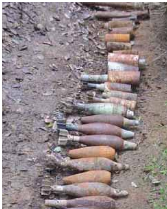
Munitions abandonnées au Sri Lanka Abandoned ammunition in Sri Lanka

a fixé l'année 2006 comme échéance pour un Sri Lanka libre de mines. Les activités de déminage dans le pays sont coordonnées par le NSCMA (National Steering Committee for Mine Action) sous l'autorité du Ministère de la réhabilitation et du développement national.