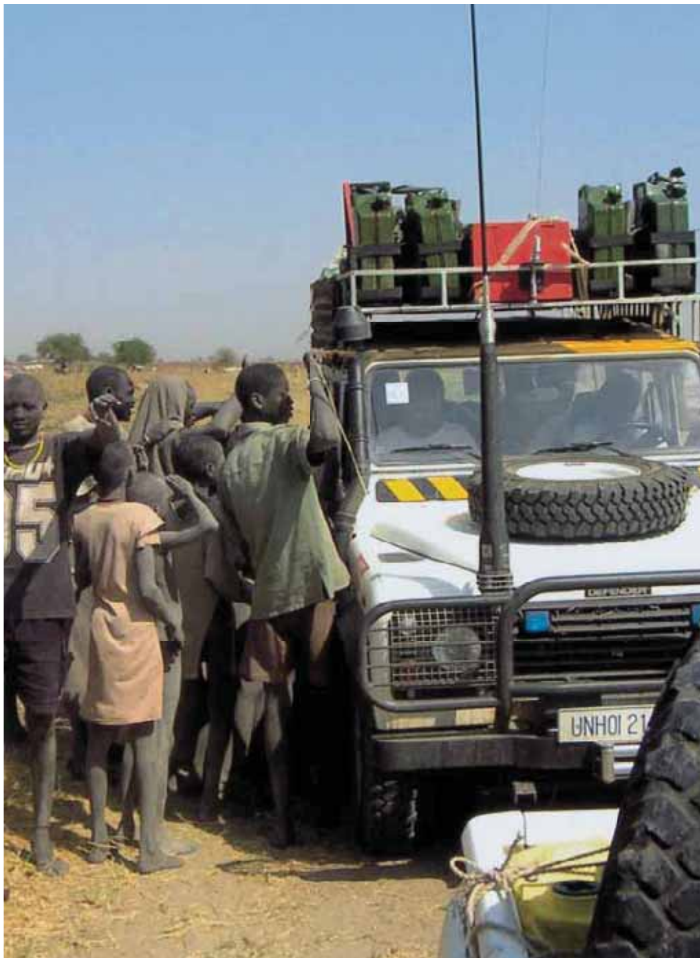
Voiture d'équipe FSD au Soudan FSD team vehicle in Sudan