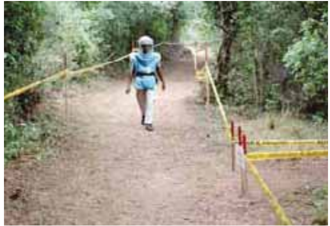
Un démineur FSD qui accède à un champ de mine au Sri Lanka An FSD deminer approaching a mine field in Sri Lanka

Suite à la signature du cessez-le-feu, le gouvernement a posé comme priorités la réhabilitation des infrastructures et la réinstallation des personnes déplacées. Mais ces objectifs ne peuvent être atteints si les territoires sont minés. En effet, une dizaine de districts sont plus ou moins sévèrement contaminés par des mines et des UXO (munitions non explosées). Terres agricoles, zones d'habitation, routes, infrastructures, accès à l'eau, abords des écoles demeurent inaccessibles et dangereux, ce qui bloque tout espoir de développement et de paix. C'est dans ce contexte que le gouvernement, assisté techniquement par l'UNDP (United Nation Development Program), l'UNICEF ainsi que plusieurs ONG internationales