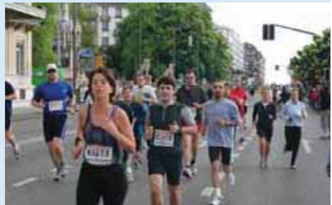
Le Marathon de Genève 2005 court en faveur de la FSD Geneva Marathon 2005 running in favour of the FSD

EXTERNAL AUDIT. As a Foundation under Swiss Law, the FSD operates under the direct supervision of the Swiss government. The accounts are audited by PricewaterhouseCoopers. Since 2003, the FSD has held the ZEW0 quality label, which testifies to the fact that the FSD is to be regarded as a trustworthy organisation because of its transparency in keeping its accounts and the quality of its projects. FSD's accounts are in full compliance with the Swiss GAAP RPC 21 accounting standard.