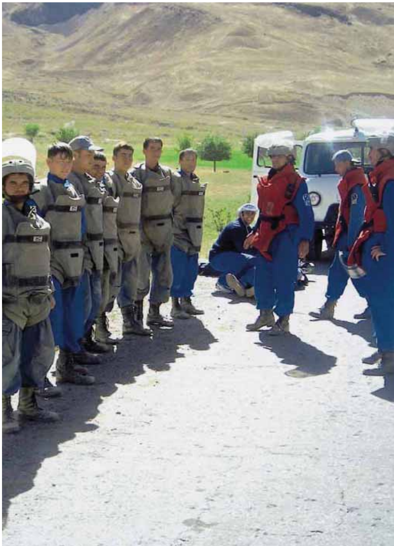
Démineurs et superviseurs FSD en préparation pour leur journée de travail FSD deminers and supervisors in Tajikistan getting prepared for their day