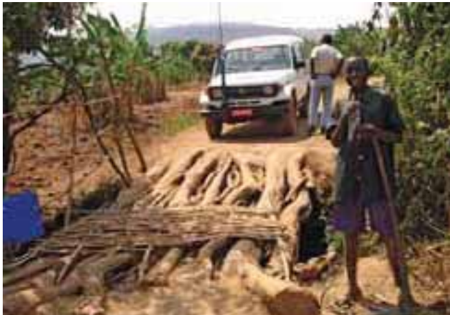
Routes difficiles au Soudan Difficult roads in sudan

LA FSD AU DARFOUR. Suite à un accident au cours duquel un véhicule de l'ONG « Save the Children » a sauté sur une mine antichar, la FSD a été envoyée par l'UNMAS afin d'intervenir en urgence au Darfour. Trois employés