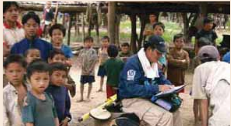
Enfants observant l'examen pour les techniciens EOD Kids observing the examen pour les techniciens EOD

Nong district, Savannakhet. Economic necessity drives villagers to seek out, collect and sell metal scrap for cash. Using locally-made metal detectors, children as young as 10 spend their days collecting scrap metal, which is then sold on to dealers. At approximately 15 cents a kilo they can recoup the cost of the detector within a month-or-two; provided they survive that long. A major cause of accidents in the affected areas is dismantling UXO for their scrap metal content, an especially hazardous way to make a living.