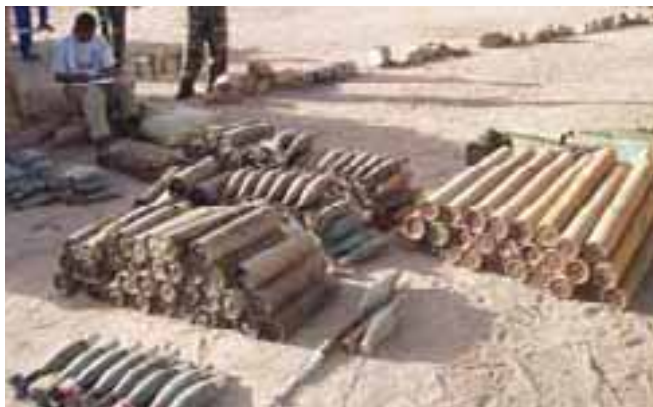
Inventaire d'engins explosifs réunis au Soudan Taking stock of collected UXO in Sudan

UN PROGRAMME DE SOUTIEN AU SERVICE DE LUTTE ANTIMINES DES NATIONS UNIES (UNMAS). Suite à un appel d'offres de l'UNOPS (United Nation Office for Project Services), la FSD a été mandatée en février 2004 afin de soutenir l'UNMAS (United Nation Mine Action Services) dans son programme d'assistance aux autorités soudanaises de lutte contre les mines et aux forces de maintien de la paix de l'ONU au Sud-Soudan. Les champs de mines sont localisés sur les pourtours des camps militaires, des villes de garnison et le long des routes et des pistes. L'intervention de la FSD vise l'identification des zones dangereuses, le marquage et la