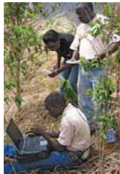
Enregistrer les coordonnées d'une zone suspecte Recording precise coordinates of a dangerous area

A ces fins, le soutien des autorités nationales, l'implication active de la société civile et une attention soutenue de la communauté internationale (plus particulièrement les instances de l'ONU et les gouvernements donateurs) demeurent indispensables en vue d'un Burundi libéré de l'impact des mines et munitions non explosées.