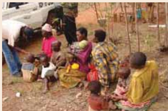
Visite d'une des 2615 collines au Burundi Visit of one out of 2615 «collines» in Burundi

In 2005, 11 provinces were surveyed in this way and two of them were considered to be potentially mined: the Provinces of Ruyigi and Rutana on the eastern border with Tanzania. The surveys will continue until April 2006 in order to cover the whole country, with a particular focus on the