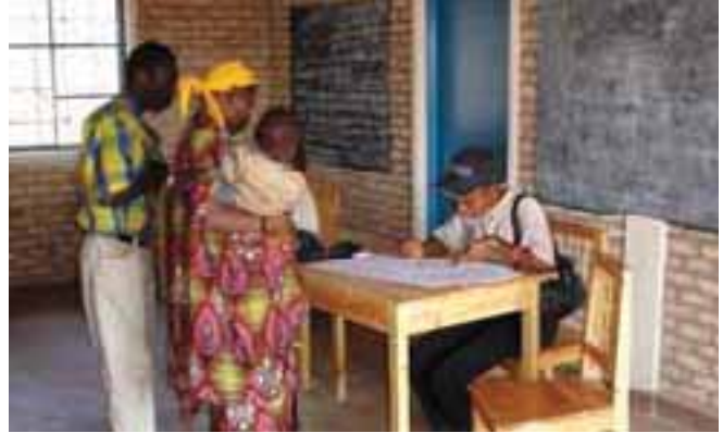
Collecte d'informations par une enquêtrice au Burundi Information gathering by an assessor in Burundi

L'ONU et les autorités gouvernementales estiment que les mines et les résidus explosifs de guerre constituent un frein majeur au mouvement