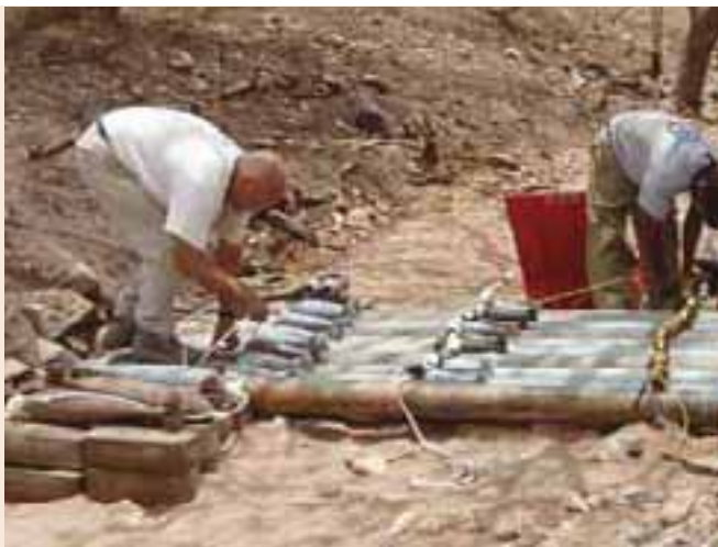
Préparation d'une destruction des munitions non-explosées Preparing for a UXO destruction

THE FSD IN DARFUR. Following an incident in which a vehicle from the NGO "Save the Children" was blown up by an antitank mine, FSD was sent by UNMAS to intervene urgently in Darfur. Three FSD workers have been deployed (two EOD Technicians and one medical worker) permanently to Darfur where they are carrying out route surveys, technical assessments and emergency interventions. The FSD has identified and destroyed over 200 explosive devices there.