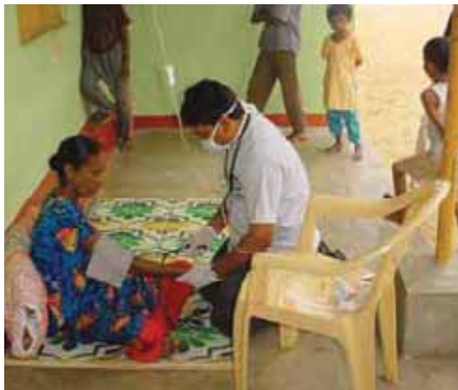
Un médecin de la FSD soigne une victime du Tsunami An FSD medic treating a Tsunami victim

INTERVENTION D'URGENCE LORS DU TSUNAMI. Dès le lendemain de la catastrophe qui a touché de plein fouet le Sri Lanka, la FSD a décidé de suspendre ses opérations de déminage pour mettre son personnel à disposition des victimes du Tsunami. Une centaine d'employés de la FSD au Sri Lanka ont ainsi quitté leur lieu de travail pour se rendre dans les régions gravement touchées de Mullaittivu et Batticaloa et une équipe internationale de spécialistes en intervention d'urgence, dont un médecin et un