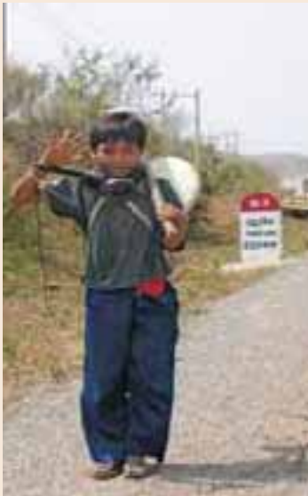
Enfant Laotien «en mission» dangereuse Child in Laos on a dangerous «mission»

Swiss communes contributed to the launching of the FSD programme in Laos, which is currently funded by the Australian and American governments, The Greendale Foundation, the sponsorship Fund of the Industrial Services of Geneva and the Karl Popper Foundation. Further donor support is still being sought.