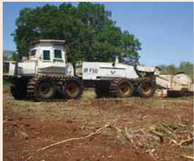
Fléau rotatif «Scanjack» Heavy flail «Scanjack»

national deminers to form technical survey teams. These mobile teams conducted emergency surveys, identified and marked Dangerous Areas, carried out limited mine clearance on small mined areas and frequently located and destroyed explosive devices that presented an imminent danger to the population. In November 2005, the program was extended by the inclusion of two new demining teams in Kadugli and one new demining team in Rumbek. In 2005, these mobile teams cleared over 10000 m 2 , marked 12 minefields and destroyed over 80 mines and 3495 UXO. In December, the southern component moved from Rumbek to Juba in line