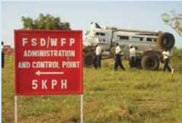
Un véhicule blindé pour le transport de personnel au Soudan FSD armoured personnel carrier in Sudan

ses comptes est effectué par PricewaterhouseCooper en qualité d'organe de révision de la fondation. En 2003, elle a obtenu la certification ZEW0 qui atteste que la FSD mérite confiance par la transparence dans la tenue de ses comptes et par la qualité de ses projets. Sa gestion comptable répond aux standards Swiss GAAP RPC 21.