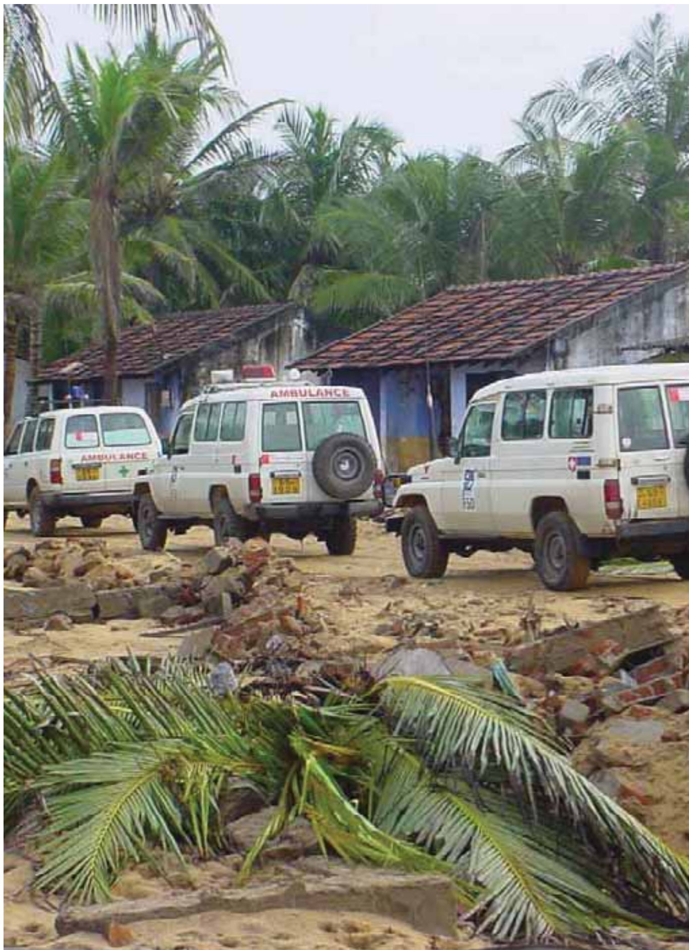
La flotte des véhicules de la FSD en soutien de l'action d'urgence à Ampara The FSD vehicle fleet in support of the emergency operation in Ampara