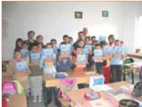
Sensibilisation dans une classe de primaire et auprès d'étudiants en master humanitaire