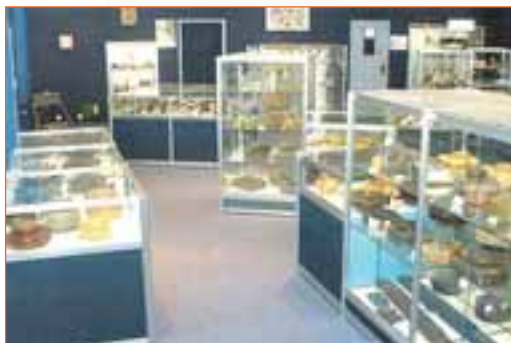
La plus grande et plus complète base de données mines au monde est à Angers

Un autre projet multimédia ( non chiffré, mais étude en cours ) anime l'association. L'objet est de signer un partenariat avec l'association « Dessine-moi un sourire » pour la création d'un outil qui aurait pour objet de compléter les bases de données des Centres départementaux de Documentation Pédagogique (CDDP). Les enseignants pourraient y trouver, en matière de lutte contre les munitions dangereuses les informations nécessaires pour sensibiliser leurs élèves dans le cadre, notamment, du « devoir de citoyenneté ».