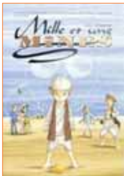
Bande dessinée « Mille et une mines »