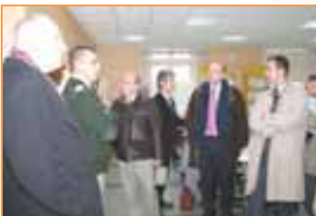
Visite de la Fondation St Cyr