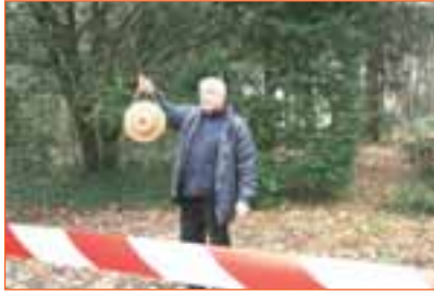
Grâce au Kit Pédagogique des vies seront sans doute sauvées