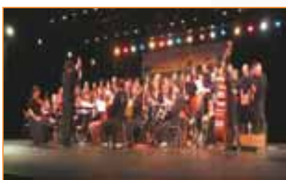
Co-organisation d'un concert humanitaire au profit d'un dispensaire au Cambodge

Cette communication se matérialise plus concrètement par la capacité de l'association à :