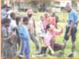
Séances de sensibilisation