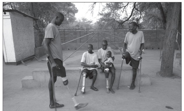
Lokichokio, Kenya. Patients devant le centre orthopédique CICR réapprenant comment marcher. AO-E-00188

de remédier à la situation. Les activités prescrites par la Convention sur l'interdiction des mines antipersonnel sont actuellement en cours dans ces deux pays afin d'éliminer les dangers que ces armes représentent pour les civils. Les tableaux ci-dessous montrent un certain nombre de réussites et de défis observés en Angola et au Mozambique ; ils offrent également des indications capitales sur les succès et les difficultés rencontrés dans la mise en œuvre de la Convention.