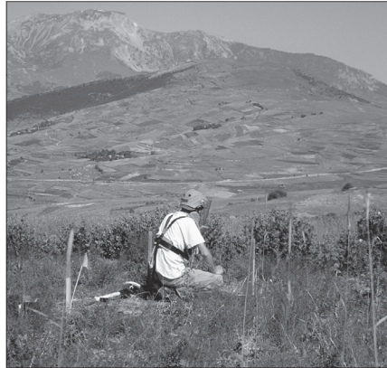
Albanie. Déminage effectué par la "Fondation Suisse de déminage". AL-D-00070

Grâce aux investissements considérables consentis pour la formation à la réduction des risques dus aux mines (notamment dans les pays qui n'ont été touchés que