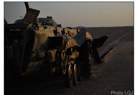
Carcasse de char - Le site de Wadi Doum garde encore les séquelles des combats qui y ont été menés en 1987 entre l'armée Tchadienne et l'armée Libyenne qui y avait établi sa base.

Il a non seulement eu l'occasion de se rendre compte de la longueur et des difficultés du trajet pour se rendre à Wadi Doum, mais également d'être confronté à l'environnement de travail hostile, d'être informé sur les techniques de déminage et de vivre au jour le jour le quotidien des membres de l'équipe.