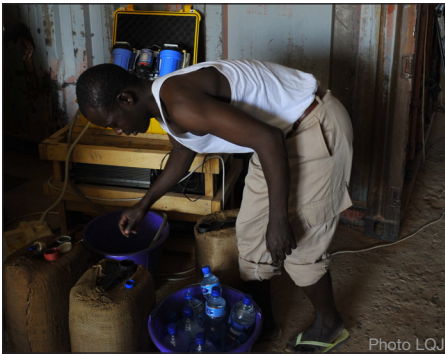
Station de filtrage de l'eau - Bien que l'eau provienne d'un puits fermé se trouvant non loin de la base, le filtrage reste indispensable.

Une première semaine de préparatif à la capitale aura été nécessaire pour procéder au contrôle technique de l'équipement et à la maintenance des véhicules, ainsi qu'à l'achat du matériel et des consommables permettant de vivre sur le site reculé de Wadi-Doum jusqu'au terme de l'opération.