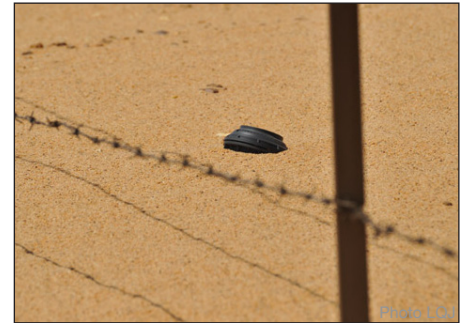
Mine antipersonnel PPM2 - Aux abords des zones minées n'ayant pas encore été dépolluées il est aisé de voir apparaître de nombreuses mines décoiffées par le vent.

DIGGER DTR Tchad a eu la chance d'accueillir durant deux semaines un journaliste suisse travaillant pour le Quotidien Jurassien.