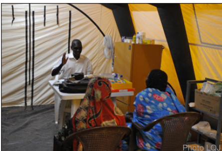
Unité médicale - Le Docteur de DIGGER DTR fournissant des consultations gratuites aux habitants des villages environnants. L'unité médicale a été généreusement mise à disposition de DIGGER DTR par le PNUD.

La machine DIGGER D-3 a ainsi pu reprendre ses activités dans le champ de mines dès le début du mois de septembre, là où elle l'avait laissé avant les vacances.