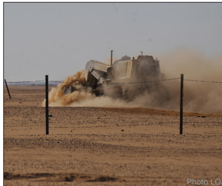
La DIGGER D-3 en plein travail - Entourée de son nuage de poussière, la machine de déminage DIGGER D-3 ne s'arrête que pour changer d'opérateur.

Après avoir terminé, fin juillet, le contrôle qualité du premier des trois champs de mines correspondants à son mandat, DIGGER DTR a eu l'occasion de remettre au Haut Commissariat National au Déminage (HCND) son rapport de conformité. Cette étape cruciale permet au HCND de poursuivre la procédure de restitution des terres à la population.