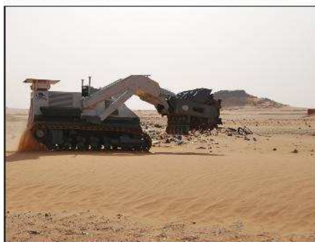
La DIGGER D-3 en mouvement sur la zone d'entraînement - Sol sablonneux constitué de rochers et de débris métalliques.

Afin de permettre une utilisation de la DIGGER D-3 dans des conditions de performance optimales, une connaissance de l'environnement de travail ainsi qu'une maîtrise de la machine est nécessaire. Un niveau de sécurité doit également être garanti - ce qui nécessite une attention particulière lors d'opération en milieu hostile tel que celui rencontré à Wadi Doum. Afin de répondre à ces exigences, une formation et un entraînement en situation réelle doivent impérativement être réalisés.