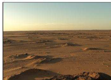
La plaine de Wadi-Doum - La beauté de ce paysage masque les dangers qui s'y cachent.

L'analyse technique et spatiale des zones minées à contrôler ayant été effectuée, il a été possible de mettre en place une zone d'entraînement réunissant des conditions similaires. Après leur entraînement intense, les opérateurs sont maintenant à même de faire évoluer efficacement la DIGGER D-3 en terrains sablonneux, malgré les difficultés de visibilité causées par les vents de sable et la poussière ambiante.