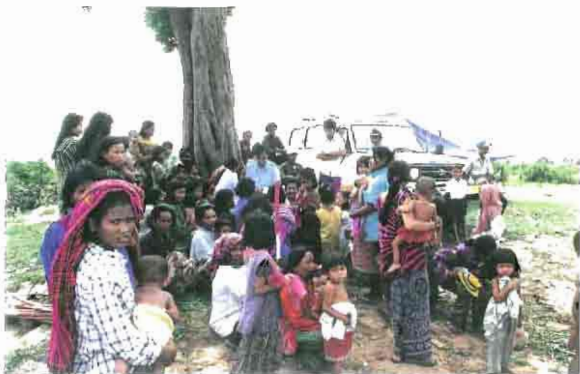
Soins à la population ( SREI SNAM - R 68 )