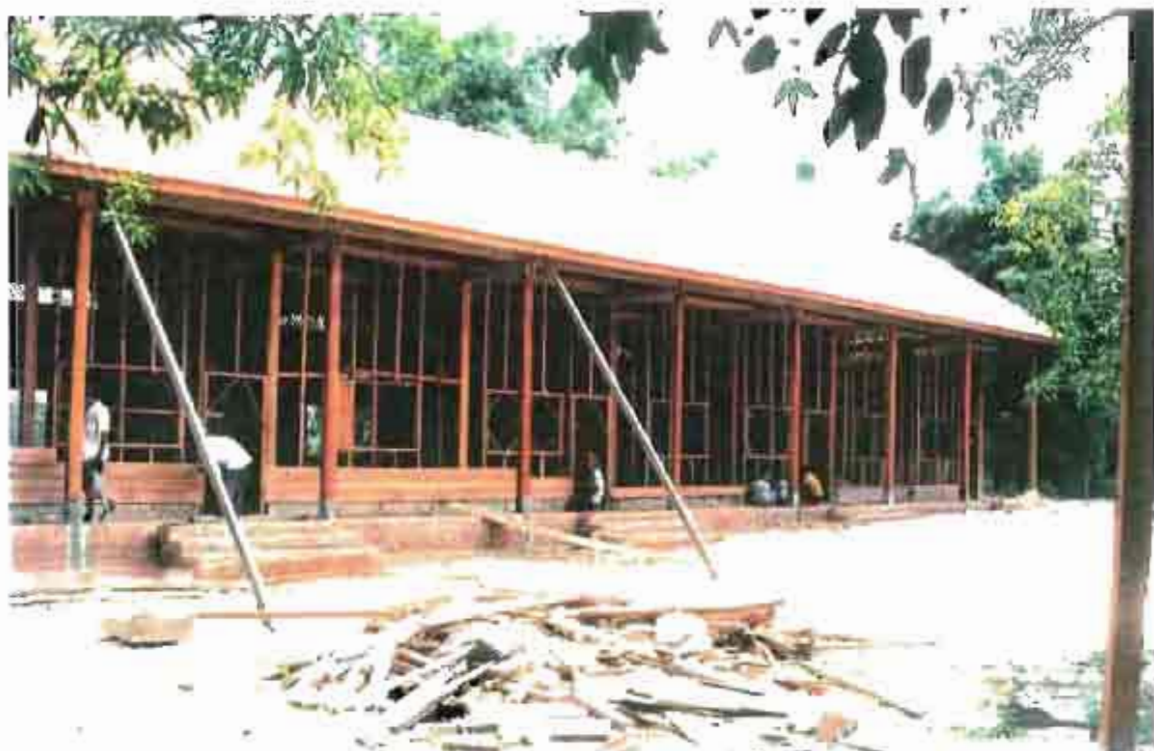
Construction d'école ( TANI - PHNOM BOK )