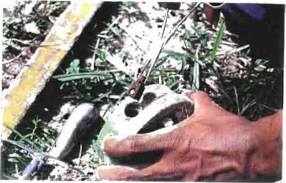
Mine anti-personnel PMN 2