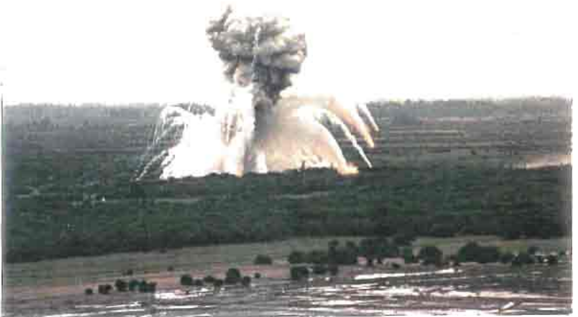
Destruction de mines et munitions au phosphore