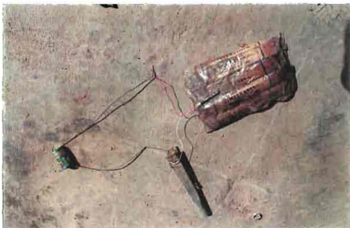
Mine de circonstance ( R 67 )