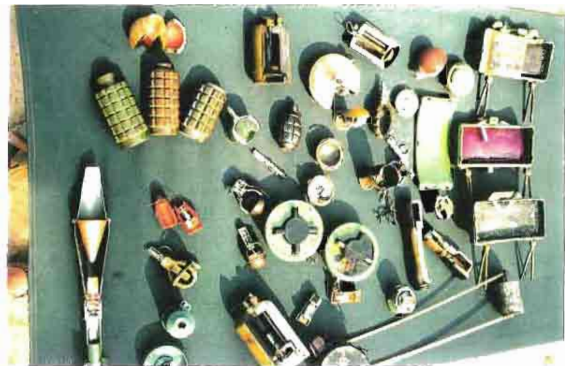
Munitions diverses ( neutralisées et découpées pour l'instruction )