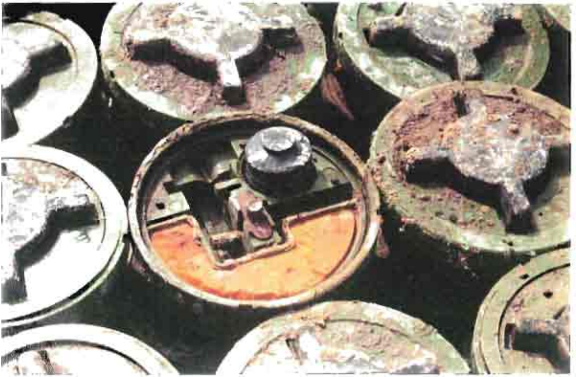
Mines PMN 2 - Soviétiques