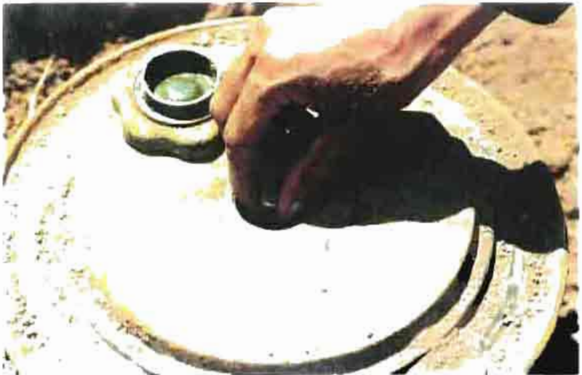
Mine anti-char TM 46