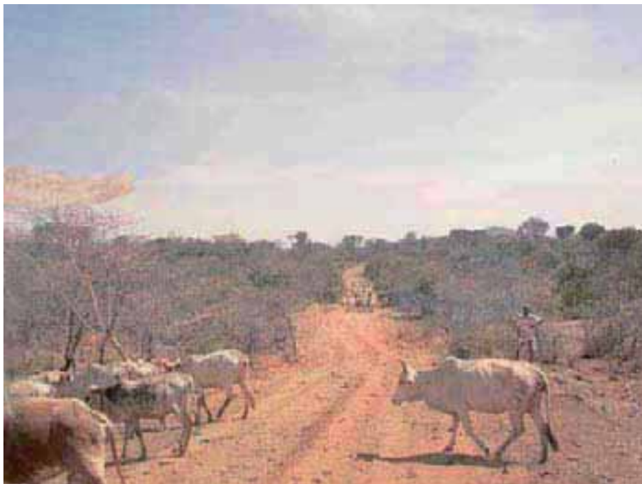
Garde du bétail dans une communauté pastorale. Les causes du niveau élevé d'armement illégal chez les pasteurs doivent trouver des solutions

L'analyse de situation doit établir les facteurs qui sous-tendent l'armement illégal des individus, des communautés ou des groupes. Qu'est-ce qui amènent les groupes cibles à s'armer illégalement? Y a-t-il des facteurs historiques qui poussent les populations à recourir aux armes ou à la violence? Quels sont les différents événements qui ont influencé les réseaux social, économique, politique et autres réseaux de sécurité, surtout parmi les diverses catégories d'âge pour les pousser aux armes et à la violence?