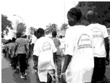
MARCHE SILENCIEUSE EN CASAMANCE

Le programme de cette journée annonçait plusieurs temps forts : une marche silencieuse, une cérémonie officielle, une table ronde et des témoignages.