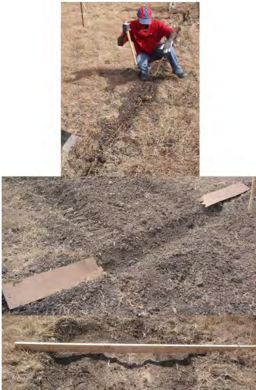
Figure 4 : installation incorrecte des panneaux, conduisant à des résultats erronés