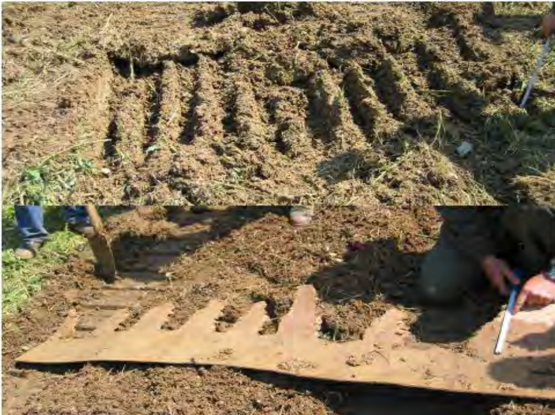
Image 2 : Mesure indirecte de la profondeur de pénétration grâce aux panneaux de bois aggloméré

Une installation correcte des panneaux de bois aggloméré est primordiale si l'on veut obtenir une représentation réaliste de la profondeur de pénétration de l'outil. Bien que simple en théorie, l'utilisation des panneaux de bois aggloméré peut être difficile à mettre en pratique, particulièrement hors des zones de tests où certains équipements ne sont alors pas disponibles. Plus haut, dans la partie « contexte », il a été mentionné l'importance d'éviter de créer des zones meubles sur le périmètre prévu pour les mesures. Intuitivement, cela paraît logique, mais on oublie souvent cette précaution lorsqu'on place des panneaux de bois aggloméré pour un test.