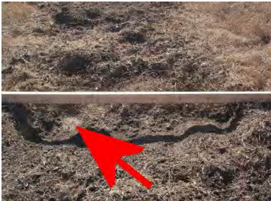
Figure 7 : Pénétration profonde du marteau sur une surface meuble