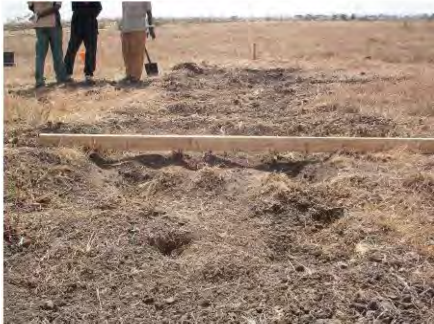
Figure 6 : Faible pénétration du marteau sur une surface dure