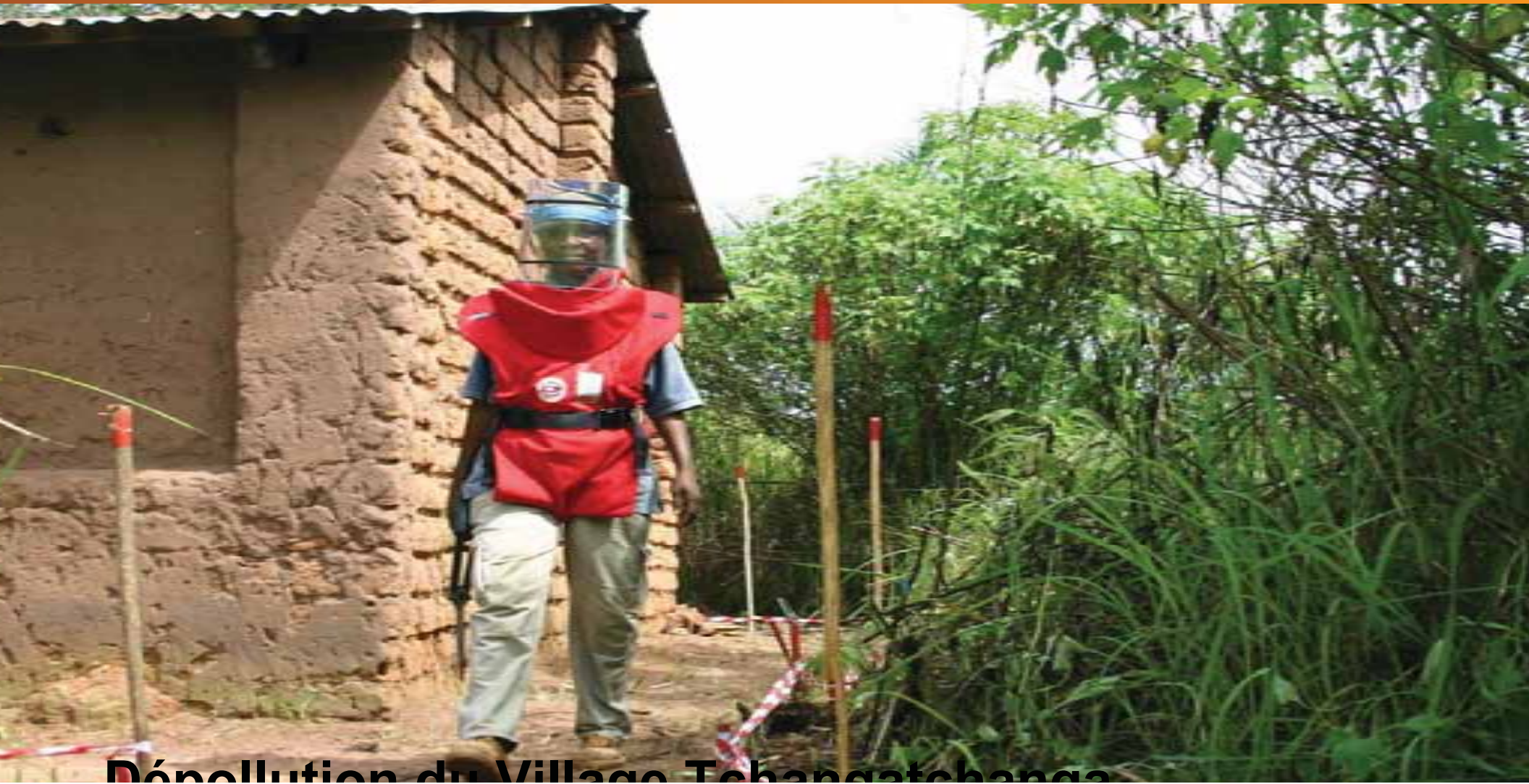
Dépollution du Village Tchangatchanga

d) Décontamination du Village Tchangatchanga déserté suite à la pollution.