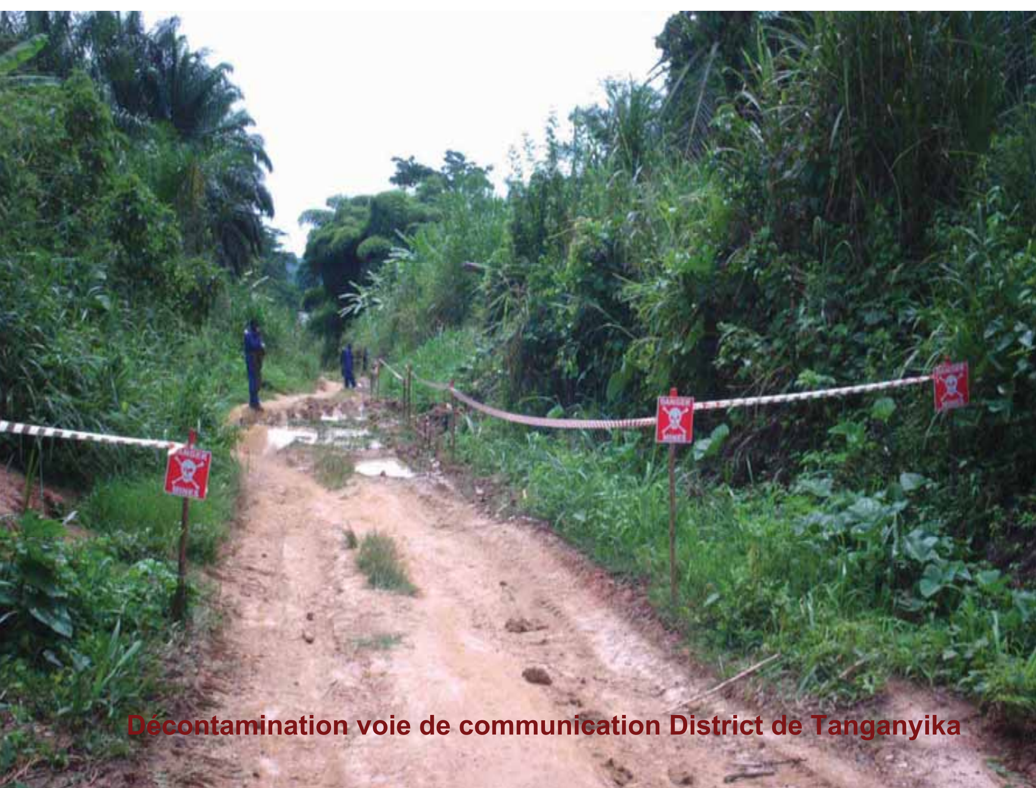
Décontamination voie de communication District de Tanganyika