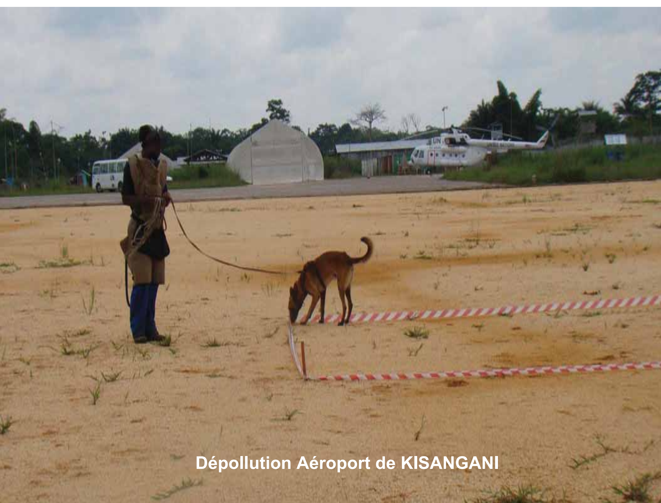
Dépollution Aéroport de KISANGANI